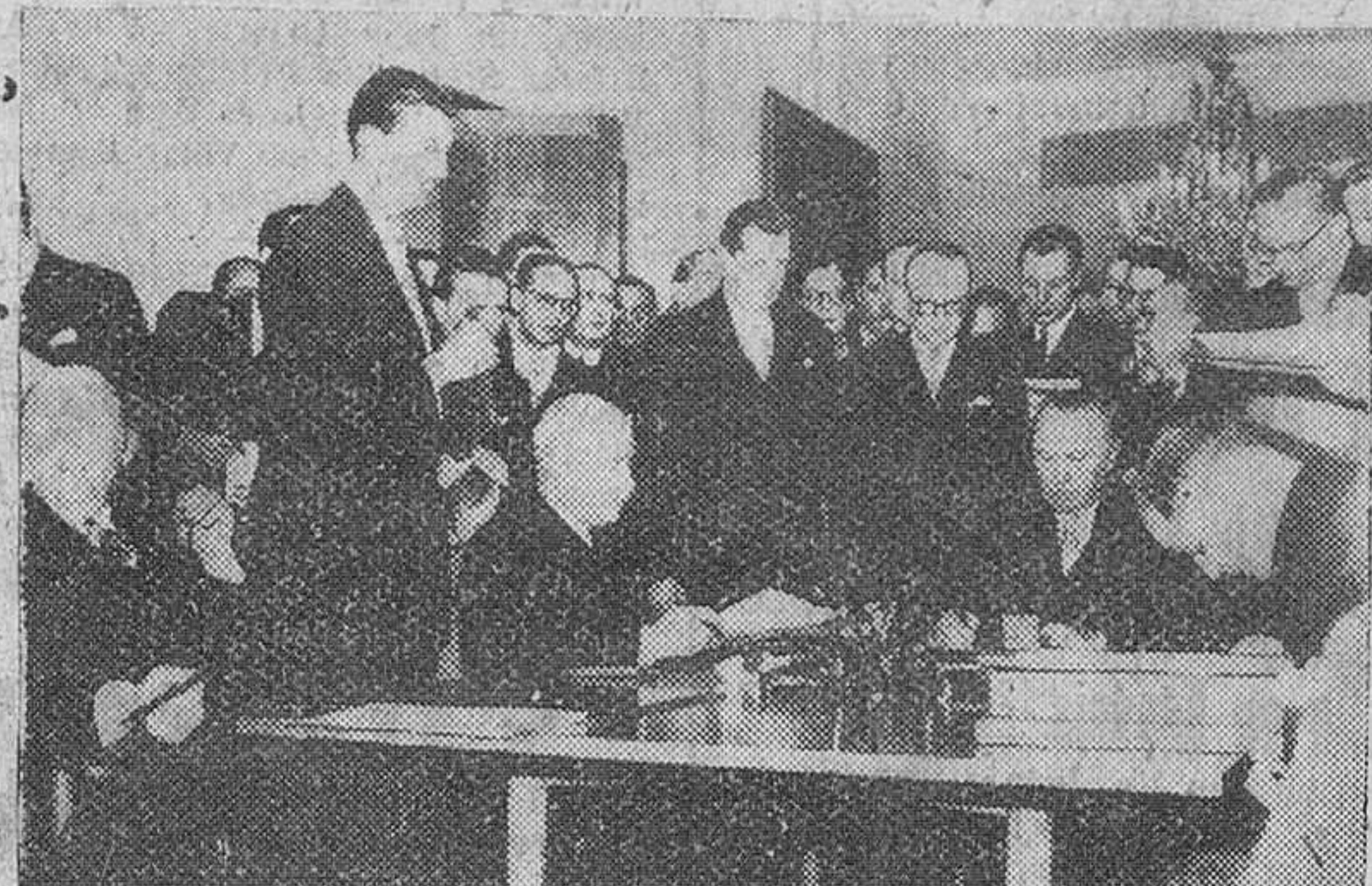
Bonn. — El canciller Adenauer con los embajadores de Francia e Inglaterra, en el momento de firmar el documento de ratificación de los acuerdos de París, por los que se devuelve a Alemania la plena soberanía, poniendo término a la ocupación y haciendo posible el rearme, hecho que ha sido calificado por Adenauer de "acto histórico".

Sidi Ifni (Africa Occidental Española). — Ha llegado el ministro del Ejército teniente general Muñoz Grandes, acompañado de su esposa y del capitán general de Canarias con sus seuitos respectivamente.