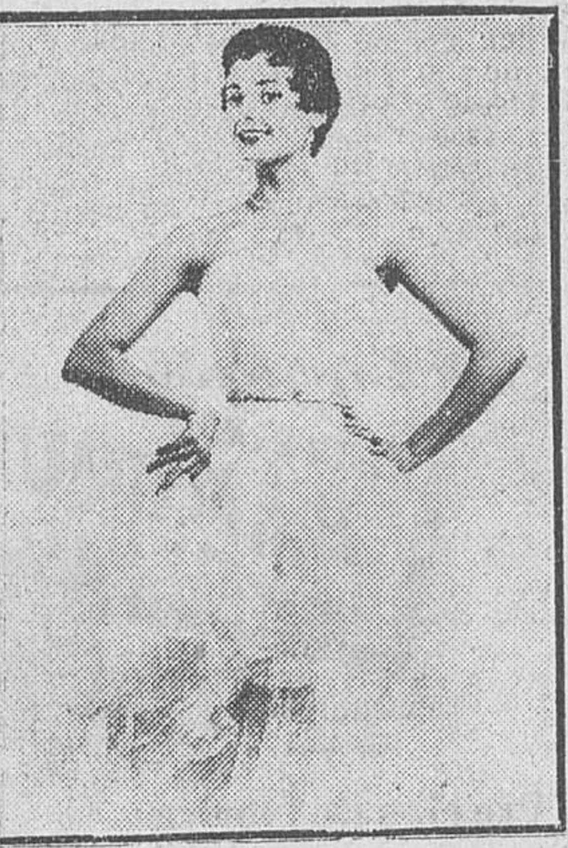
Vestido creado por Dior para la fiesta de Nochevieja. La falda doble volante y todo el está confeccionado de encaje blanco.

Los hombros han disminuido de volumen, más estrechos, más