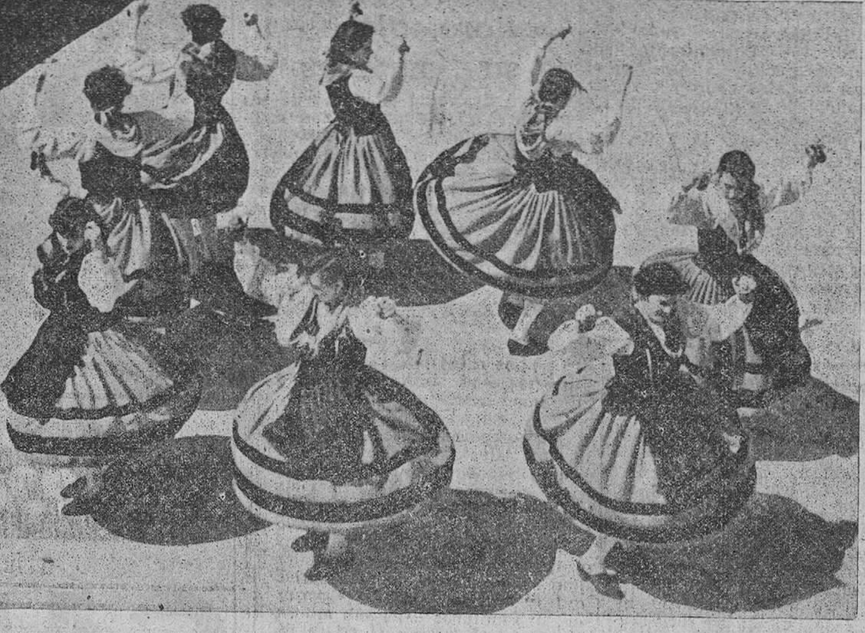
He aquí el grupo de danzas de la Sección Femenina que el verano del año último intervino en los festivales de danzas celebrados en el palacio de la Magdalena. El fotógrafo captó el momento en que las muchachas de Burgos trenzan una bella danza, "La Jerigonza", de Salas de los Infantes.

Mañana emprenden su viaje las diez muchachas burgalesas que son depositarias de un cordial mensaje del alcalde para el Ayuntamiento irlandés