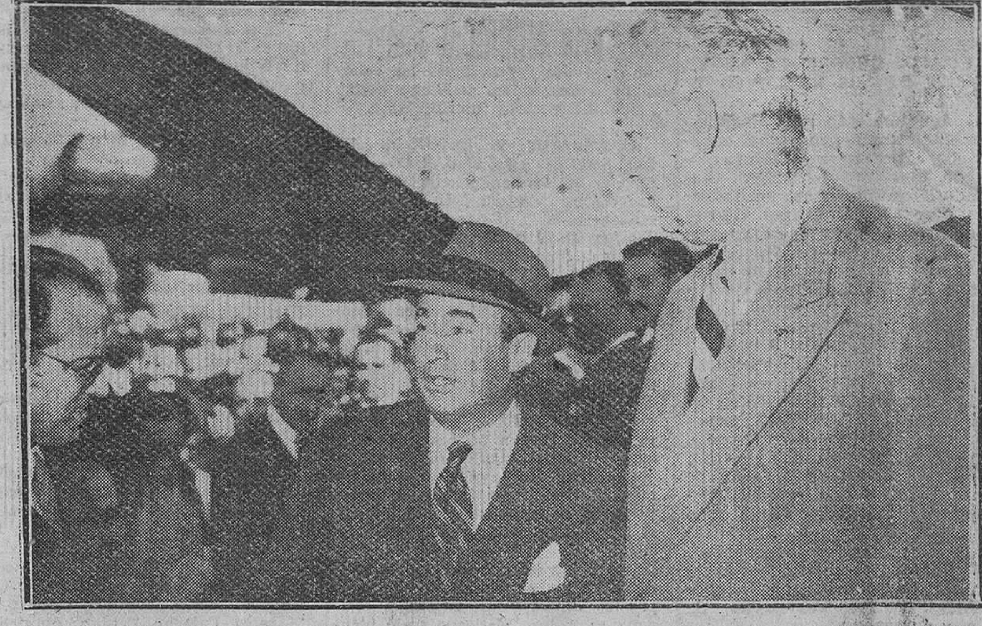
Madrid.— El ministro de Comercio español, señor Arburúa, a su llegada al aeropuerto de Barajas, de regreso de su viaje a los Estados Unidos, donde fue recibido por varios ministros del Gobierno español y otras altas personalidades.