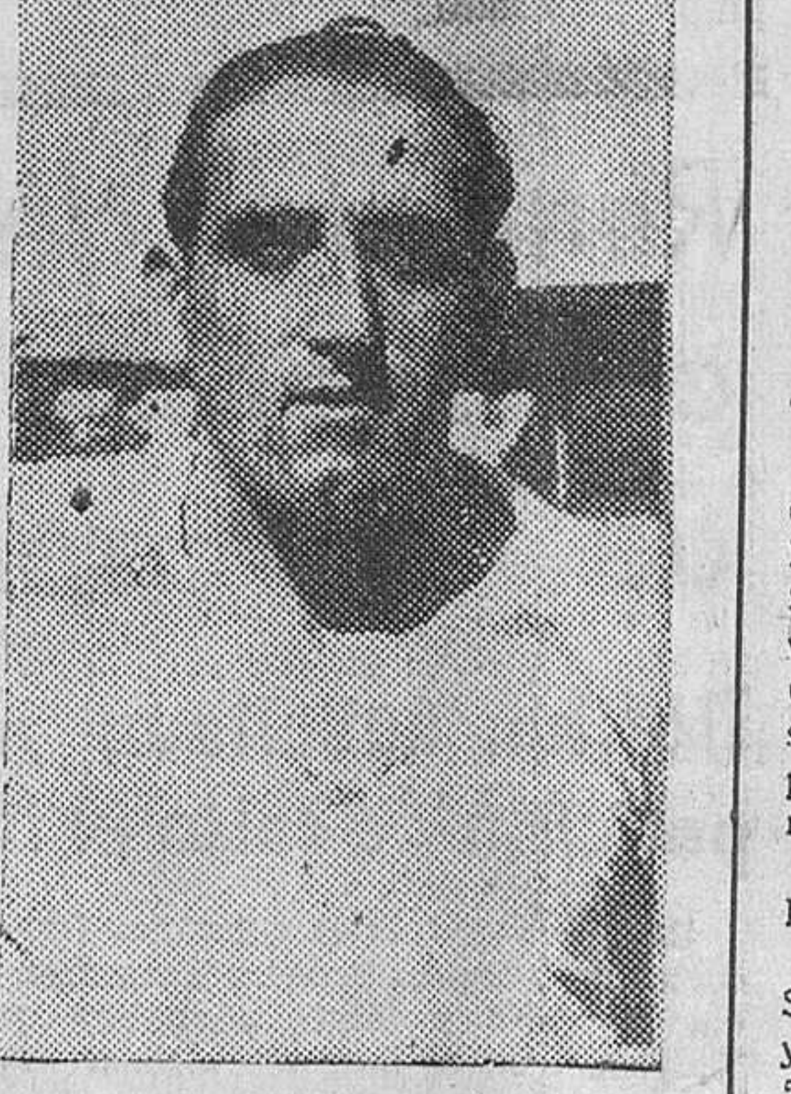
Uno de los resultados más sorprendentes de la pasada jornada y posiblemente de toda la temporada, haya sido el conseguido por la Cultural en el campo del Avilés. Tengase en cuenta que jugando en terreno adverso venció por 6-0 y aún le anulaban dos goles.