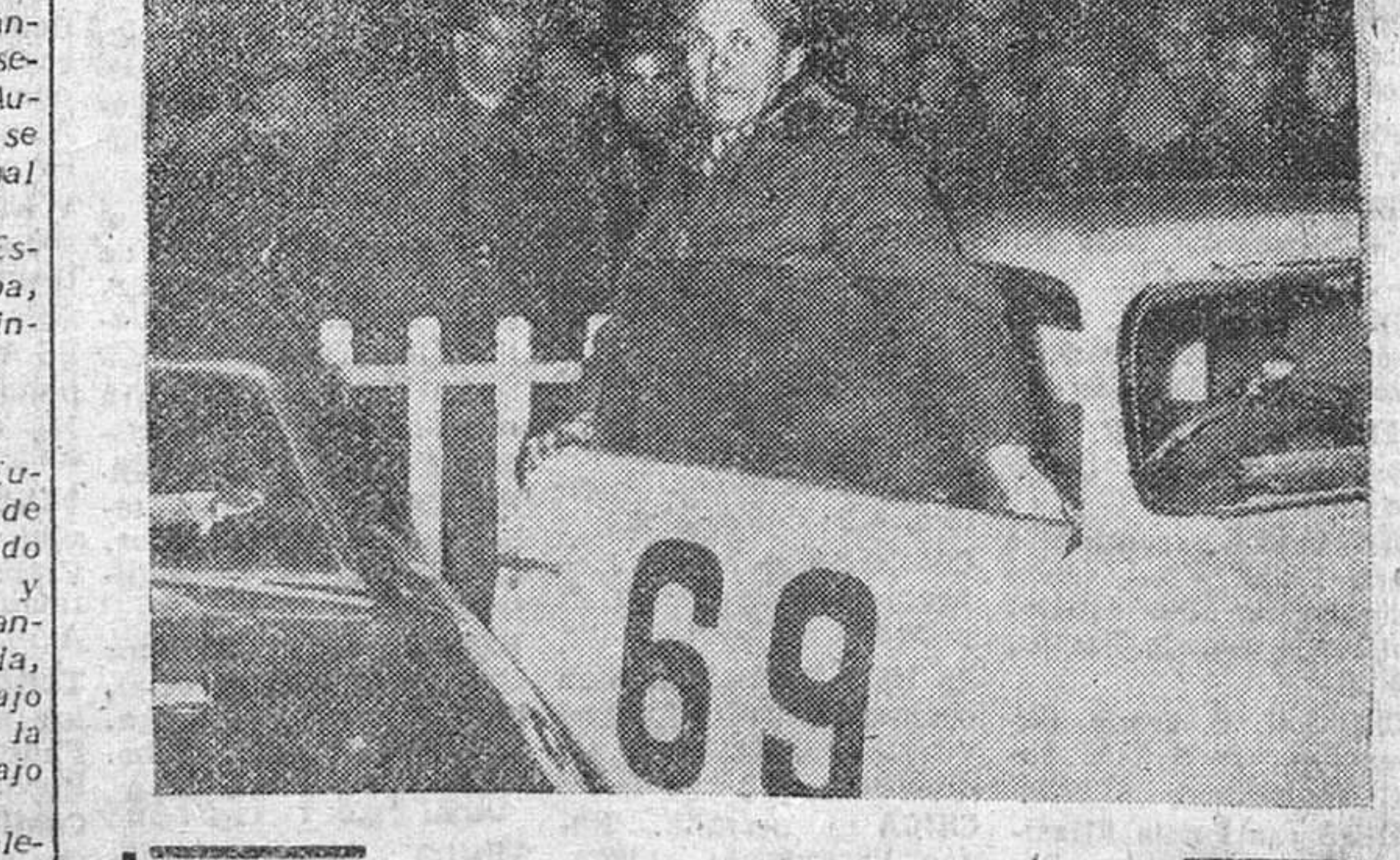
Louis Chiron, vencedor absoluto del Rallye de Montecarlo, fotografiado junto al automóvil en el que efectuó el largo recorrido de la prueba.