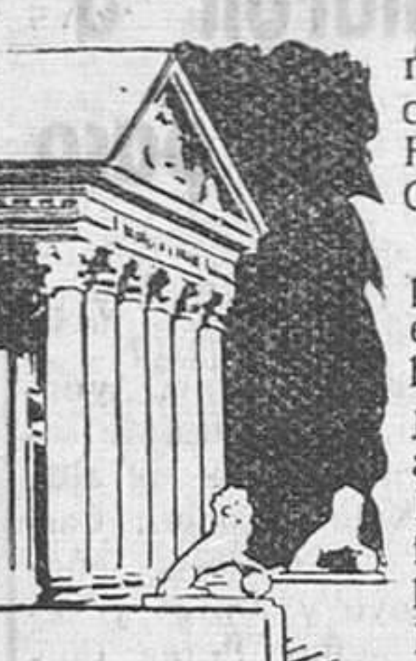
Madrid.— (Crónica de "Tachin" para DIARIO DE BURGOS.) Contra todo pronóstico, con excepción del basado en la experiencia de años anteriores, la lluvia no ha faltado a su habitual cita con la Semana Santa madrileña, aunque no ha caído constantemente. Las enormes colas formadas a la puerta de los templos para visitar los Sagrarios que

Pepe Luis Vázquez anuncia su retirada.— Llego Lana Turner.— Mundimiento en la plaza de España