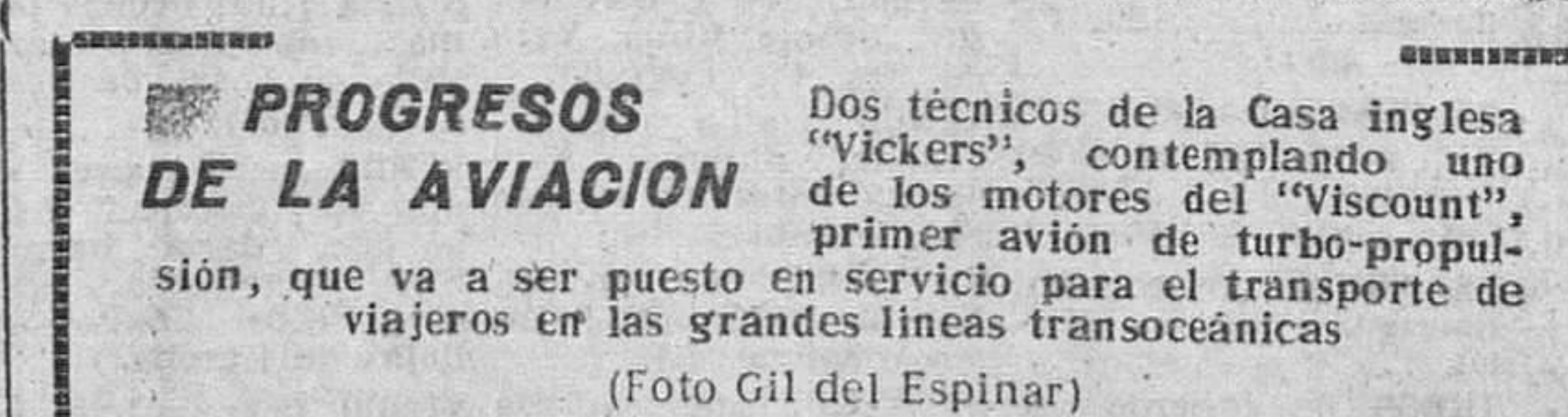
PROGRESOS DE LA AVIACION

Ha manifestado Wiley que instará a Bradley para que incremente el envío de armas a Chiang Kai Chek, ya que, en su opinión, esto hará más efecto en los chinos rojos que la desneutralización de Formosa.—Efe.