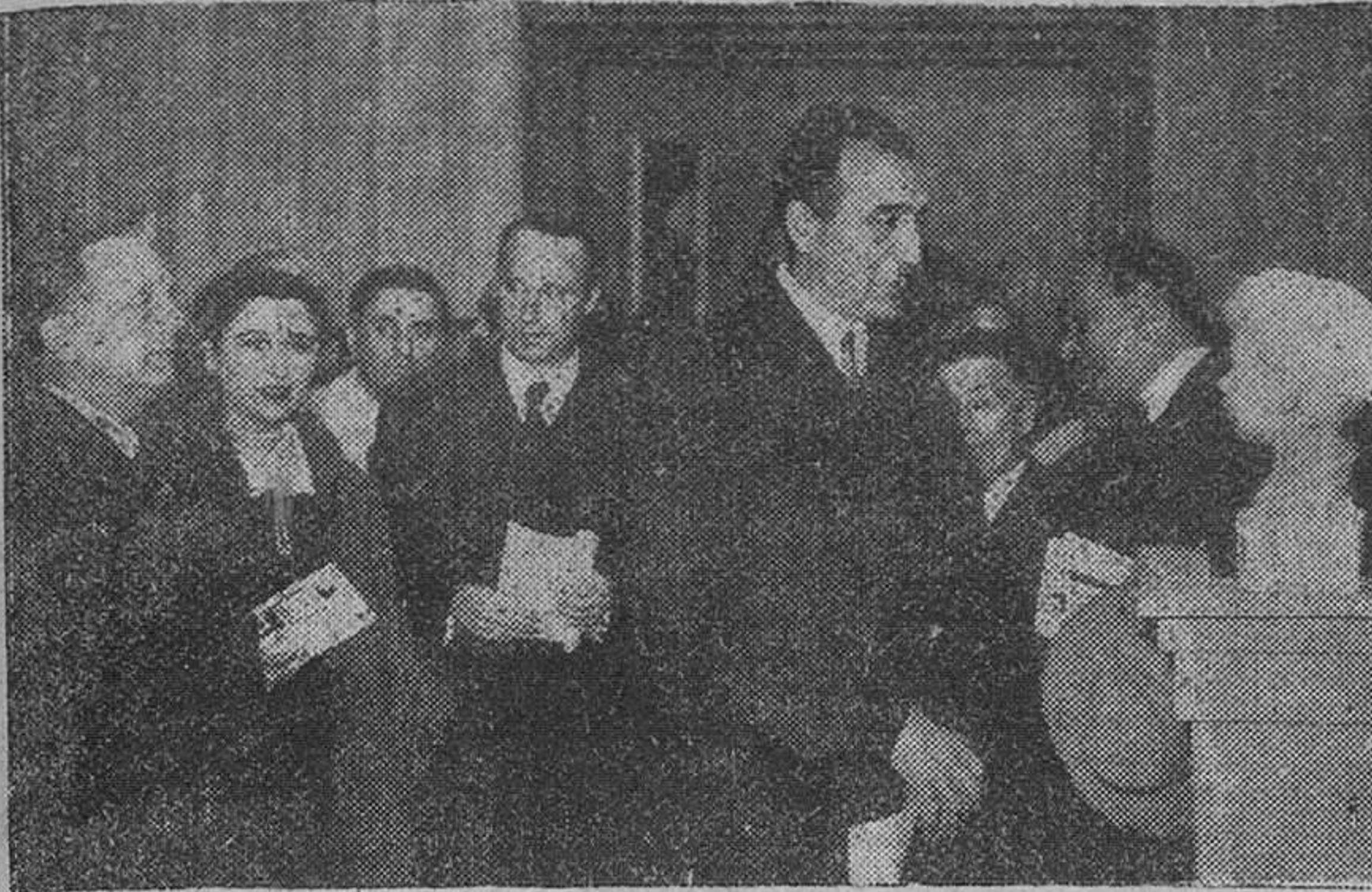
Madrid.—Esta mañana en el Palacio de El Pardo, S. E. el jefe del Estado recibió a la comisión permanente del Consejo económico sindical de Málaga, presidida por el ministro secretario general del Movimiento, y de la que forman parte, entre otras personalidades, el delegado nacional de Sindicatos, vicesecretario nacional de Ordenación Económica, obispo, gobernador civil, presidente de la Diputación y alcalde de Málaga, además de empresarios, técnicos y trabajadores, quienes hicieron entrega al Caudillo de las conclusiones del Consejo, todas ellas trascendentes para el futuro económico de aquella provincia.

Entrega a Su Excelencia de un informe sobre los problemas que afectan a las zonas pesqueras, especialmente del Norte