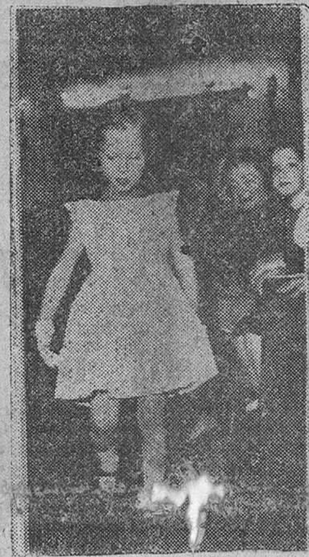
Paris.—Ha comenzado la presentación de modas de primavera y verano en Paris, exhibiéndose primero los modelos infantiles. Vemos aquí un maniquí de cinco años, luciendo un precioso vestido.