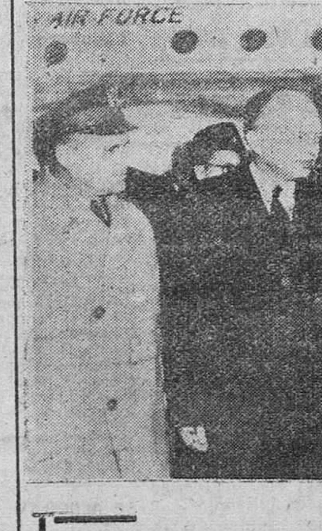
Paris.—El secretario de Estado norteamericano, Mr. Foster Dulles, a su llegada al aeródromo, donde fue recibido por el ministro de Asuntos Exteriores francés, Mr. Bidault y el comandante supremo de la N.A.T.O., general Ridgway, que aparece a la izquierda de la fotografía, al lado de Mr. Stassen, jefe de la Oficina de Seguridad Mútua.

ALARMANTE SITUACIÓN DE LOS SEMBRADOS.—Zaragoza.—Según datos facilitados por la Cámara Sindical