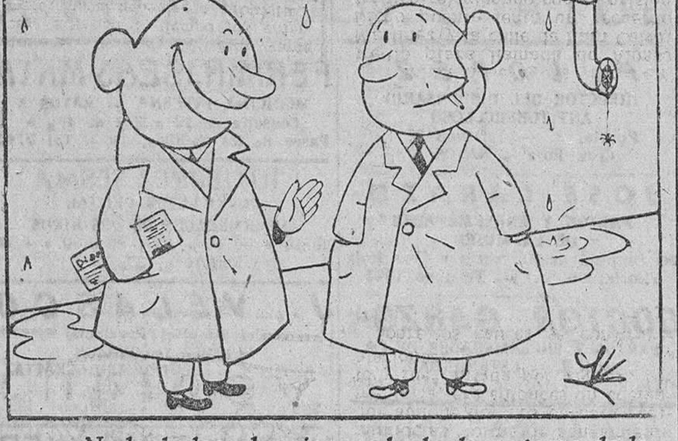
No lo dudes; el mejor modo de despegarse de la cola es «pegar» al de la cola.