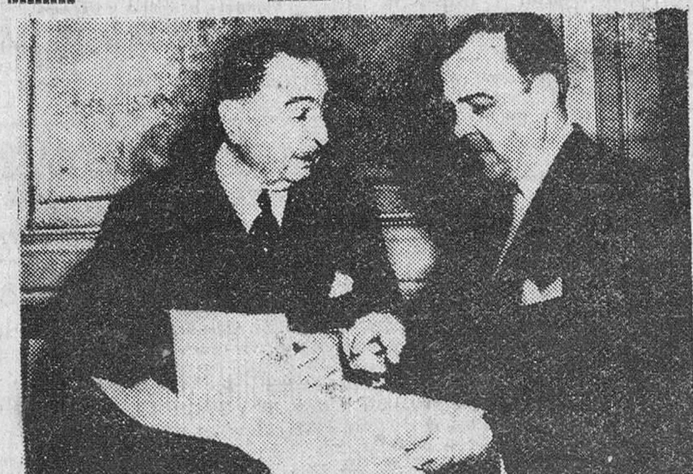
El embajador de España en Washington recibe la carta de Colón