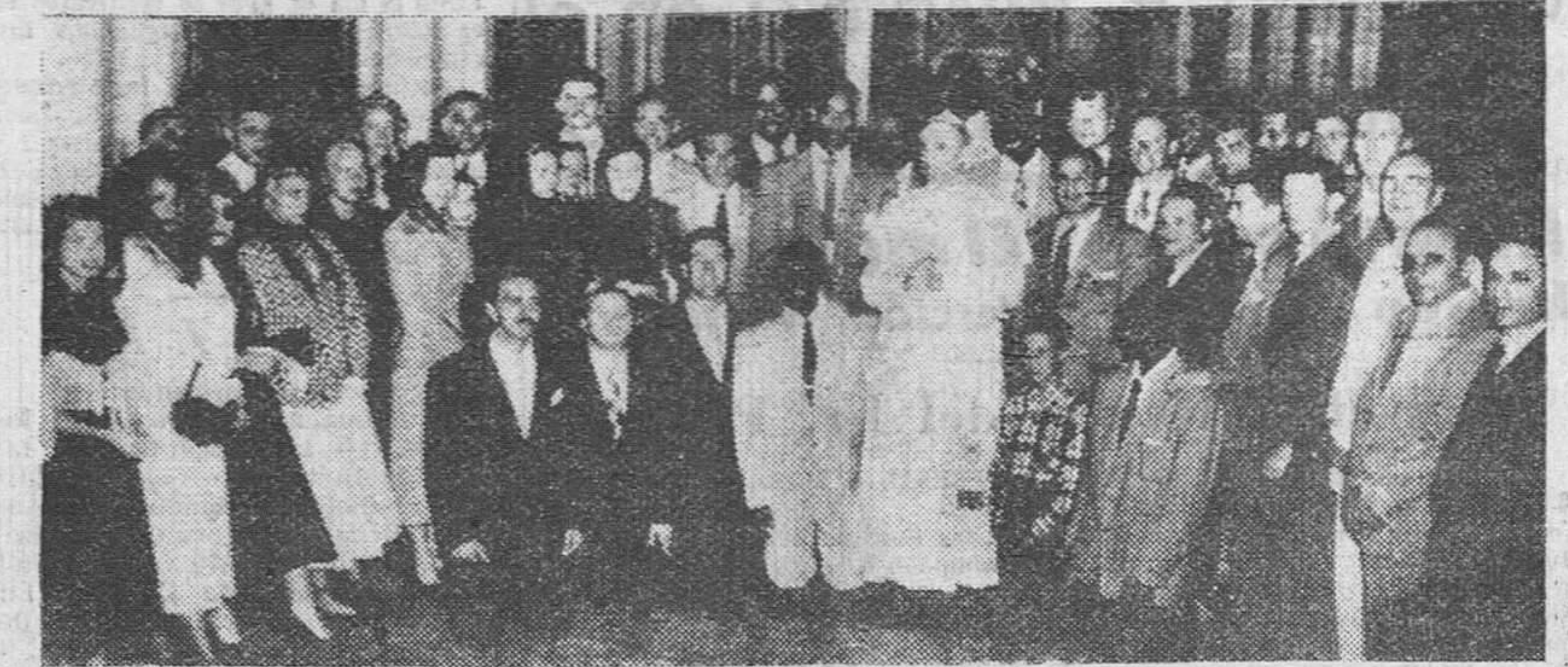
Ciudad del Vaticano. — Un momento de la audiencia privada que el Santo Padre concedió a los jugadores de baloncesto de los equipos norteamericanos "Harlem" y "Celtic", que se encuentran en Italia para jugar varios partidos.