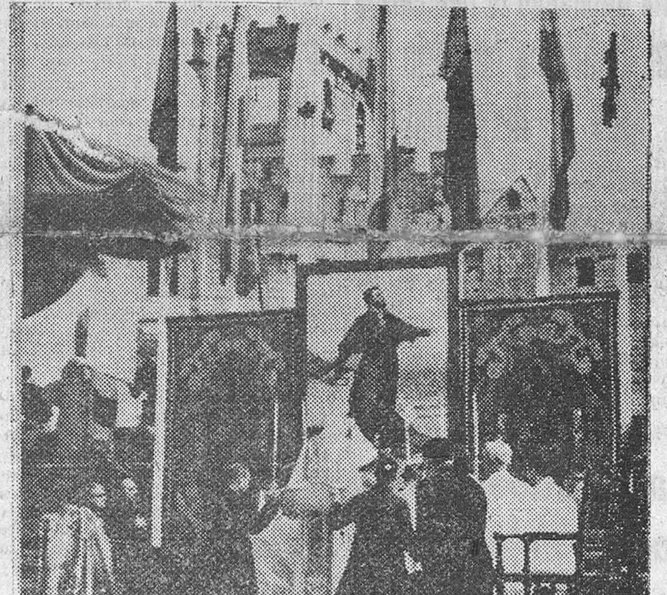
Pamplona. — El obispo de Pamplona oficiando la misa durante el homenaje de las Falanges Juveniles de Franco a San Francisco Javier, a quien han declarado Patrono.