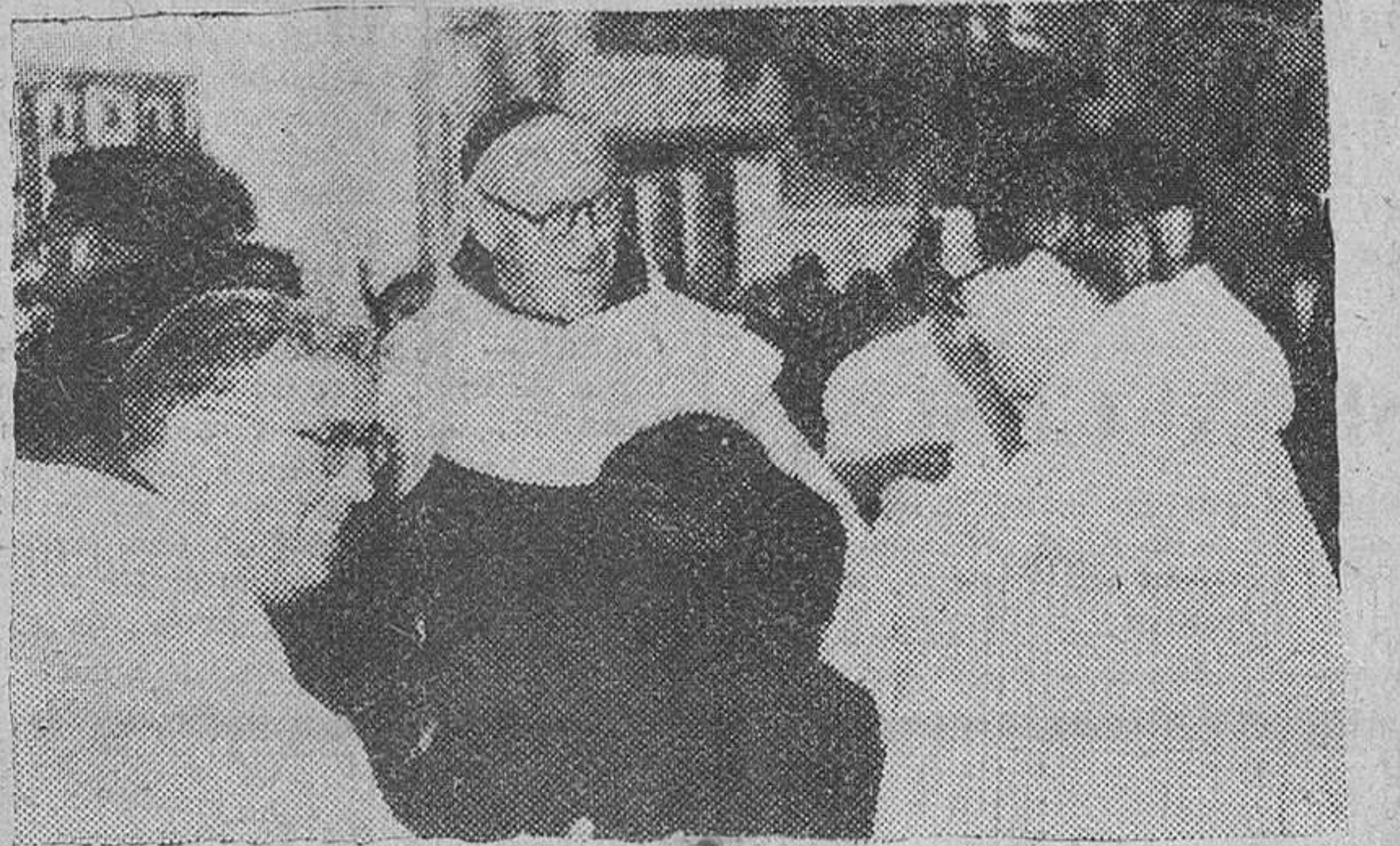
Ali Maher Pacha en un momento de su visita a Alejandría.