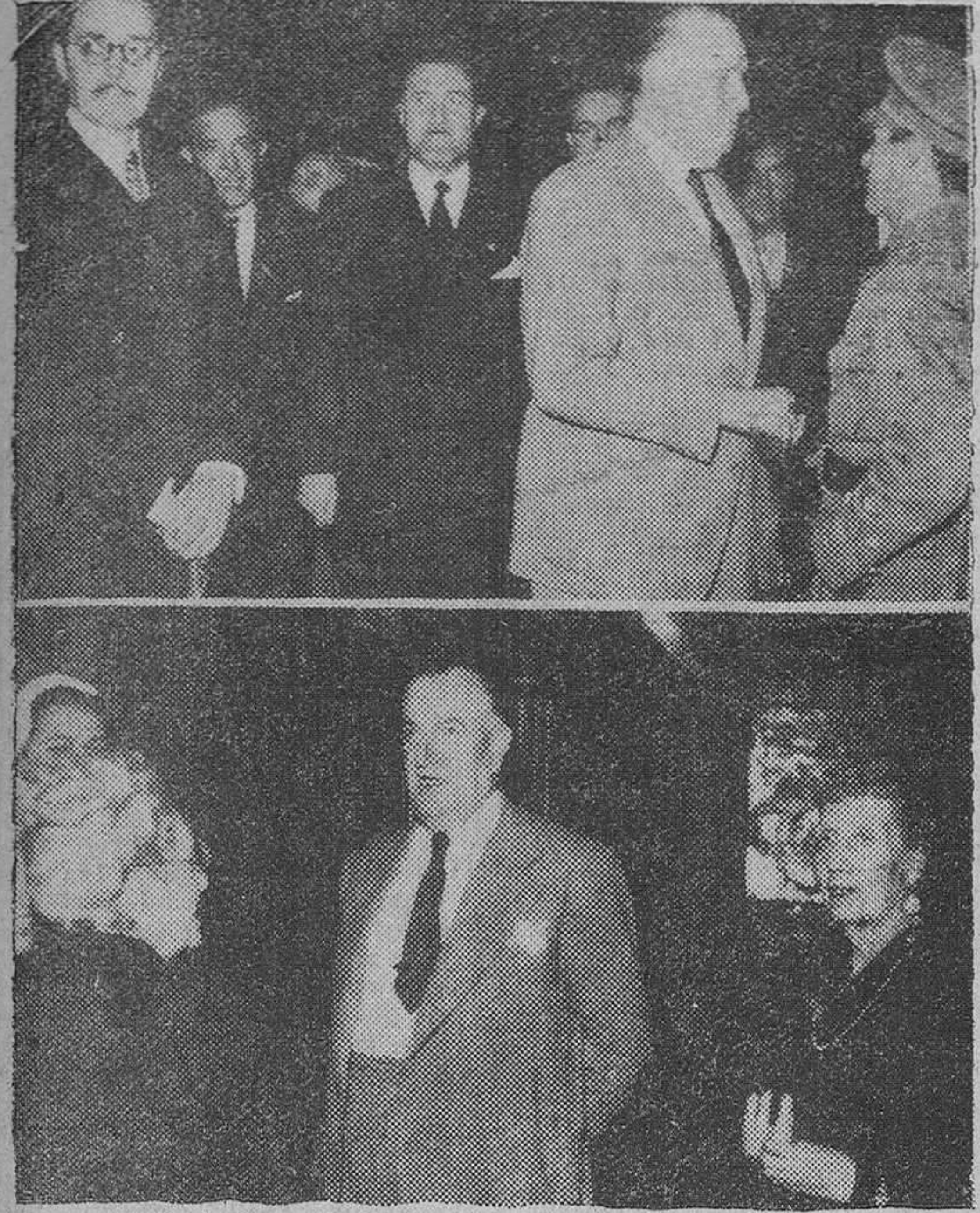
Dos momentos de la llegada del ministro de Obras Públicas a nuestra ciudad

Hoy recibirá el hábito de Caballero de la Real Cofradía de Santiago