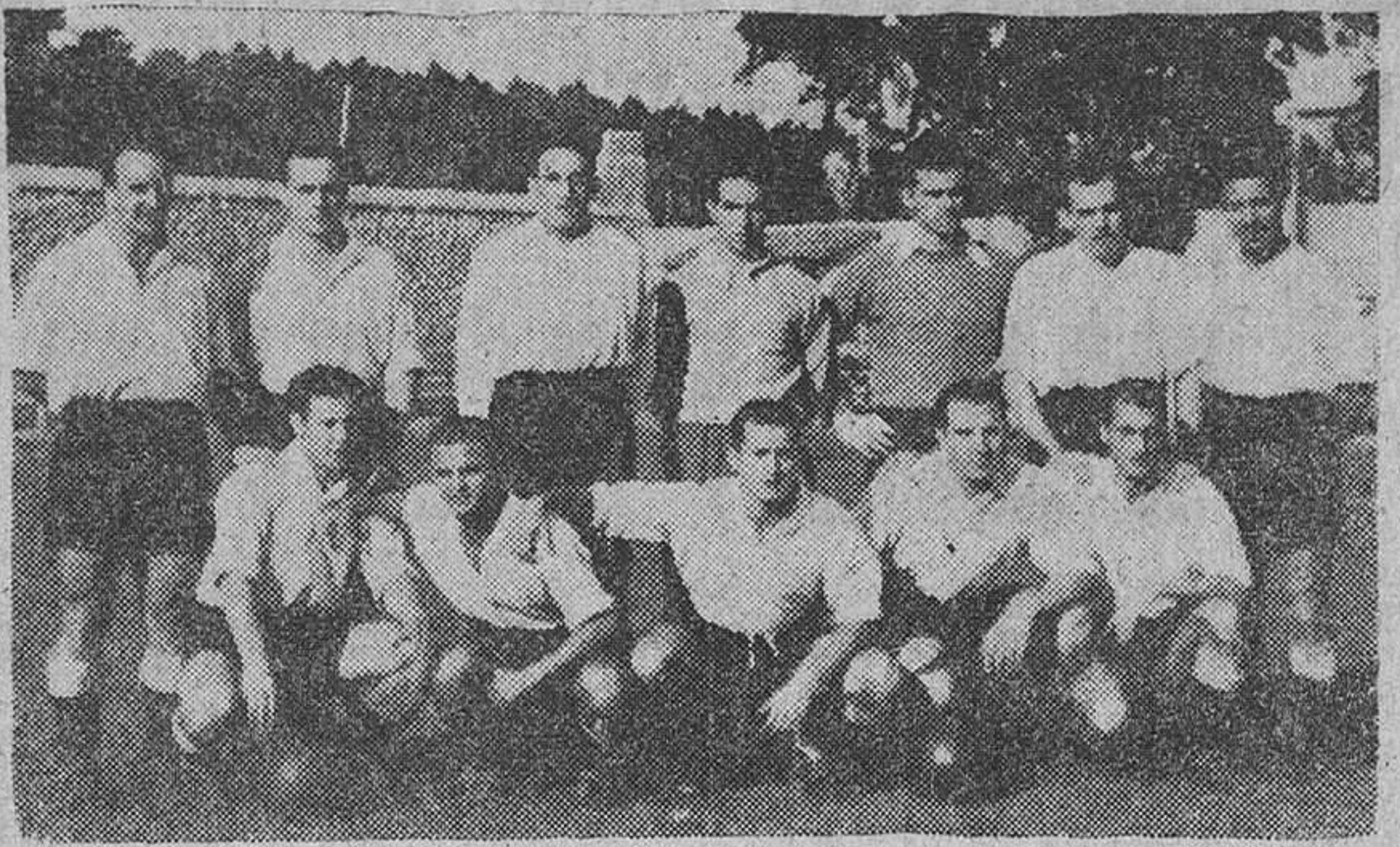
(Pasa a cuarta página)