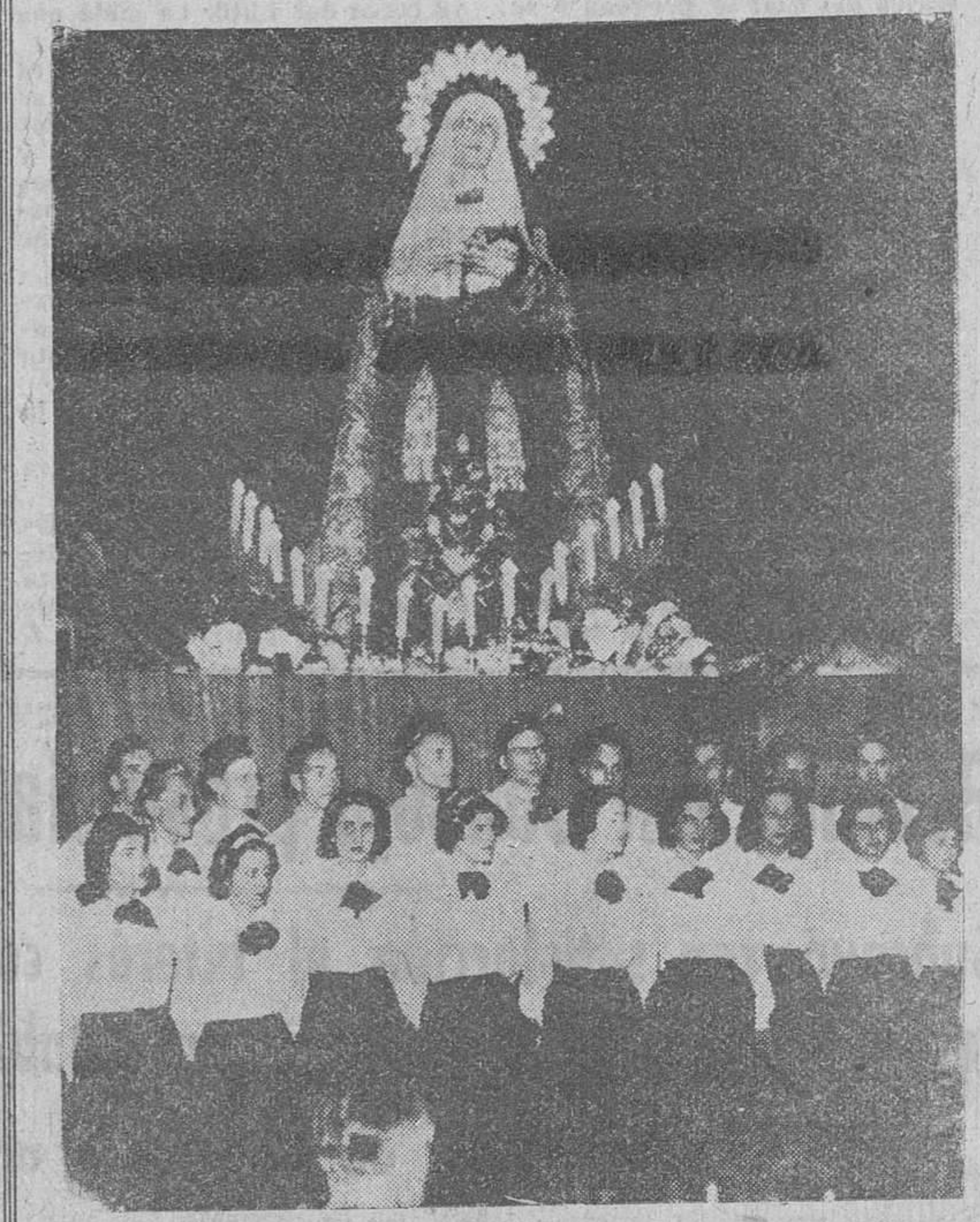
En la parte superior, la imagen de la Virgen de la Soledad, que se venera en la Iglesia parroquial de Santa Agueda, durante la procesion que recorrió ayer diversas calles burgalesas. En la fotografía inferior, la coral de universitarios católicos de Guyenne (Francia), durante el concierto sacro que dieron ayer noche en los salones de la Sociedad "Círculo de la Unión".