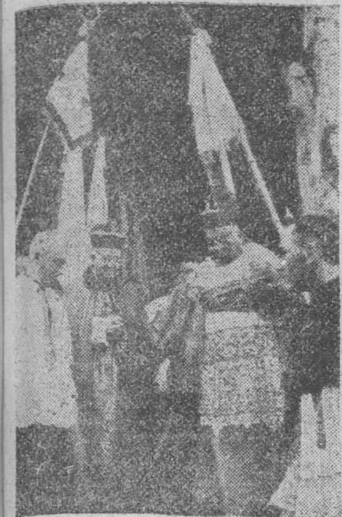
Madrid. — El Nuncio de S. S. monseñor Ciccognani, acompañado del patriarca-obispo de Madrid-Alcalá, doctor Eijo Garay, saliendo de la Iglesia Catedral de Madrid después de asistir al solemne Te Deum con motivo del Día del Papa.

Ciento cuarenta y nueve Fallos serán plantados este año en Valencia