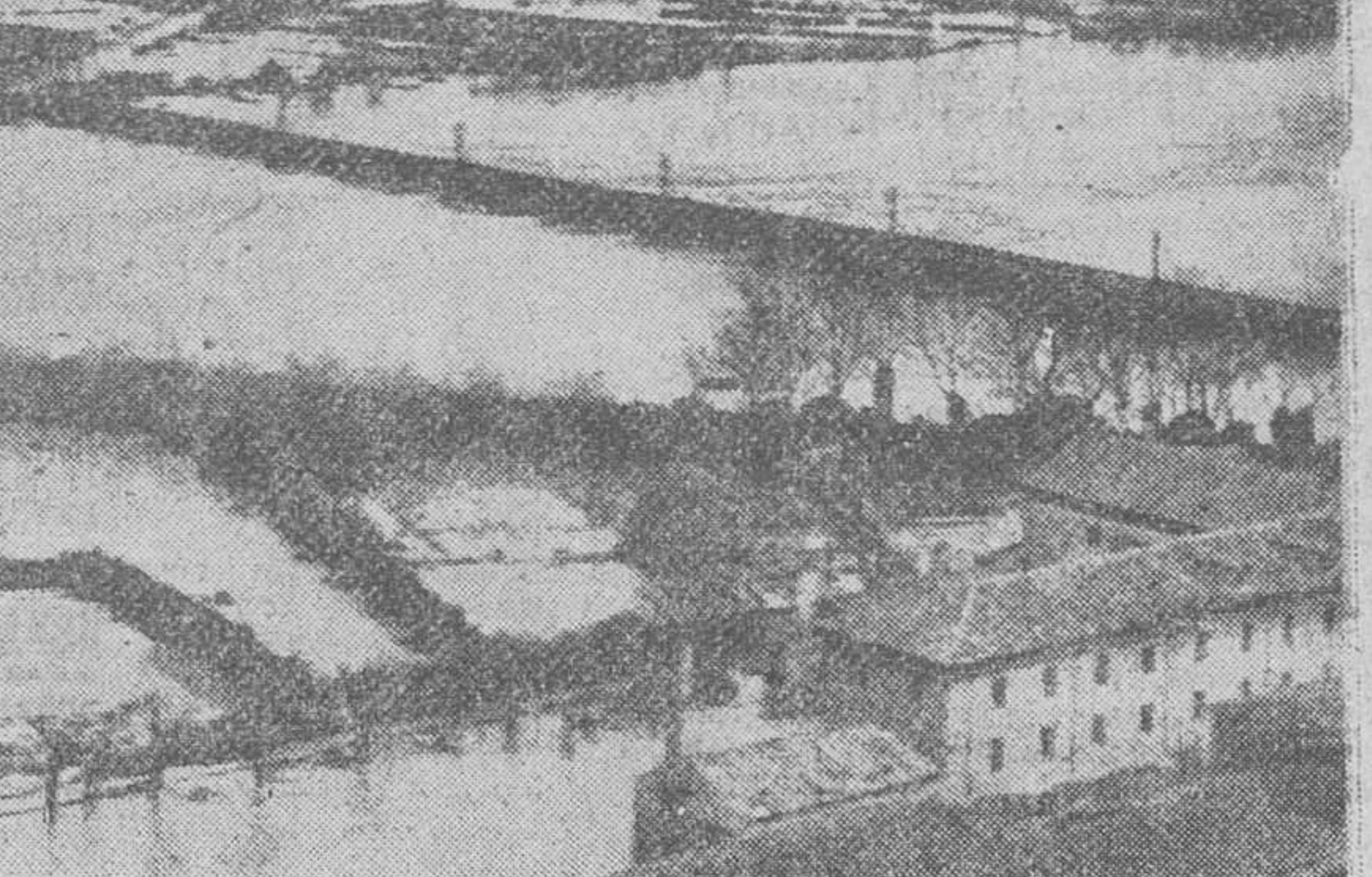
Tudela.—Una vista de la huerta de esta ciudad, llamada la "Mejana", completamente inundada al romperse los diques de contención del río Ebro, cuyas aguas alcanzaron un nivel de 6,26 metros sobre el normal.