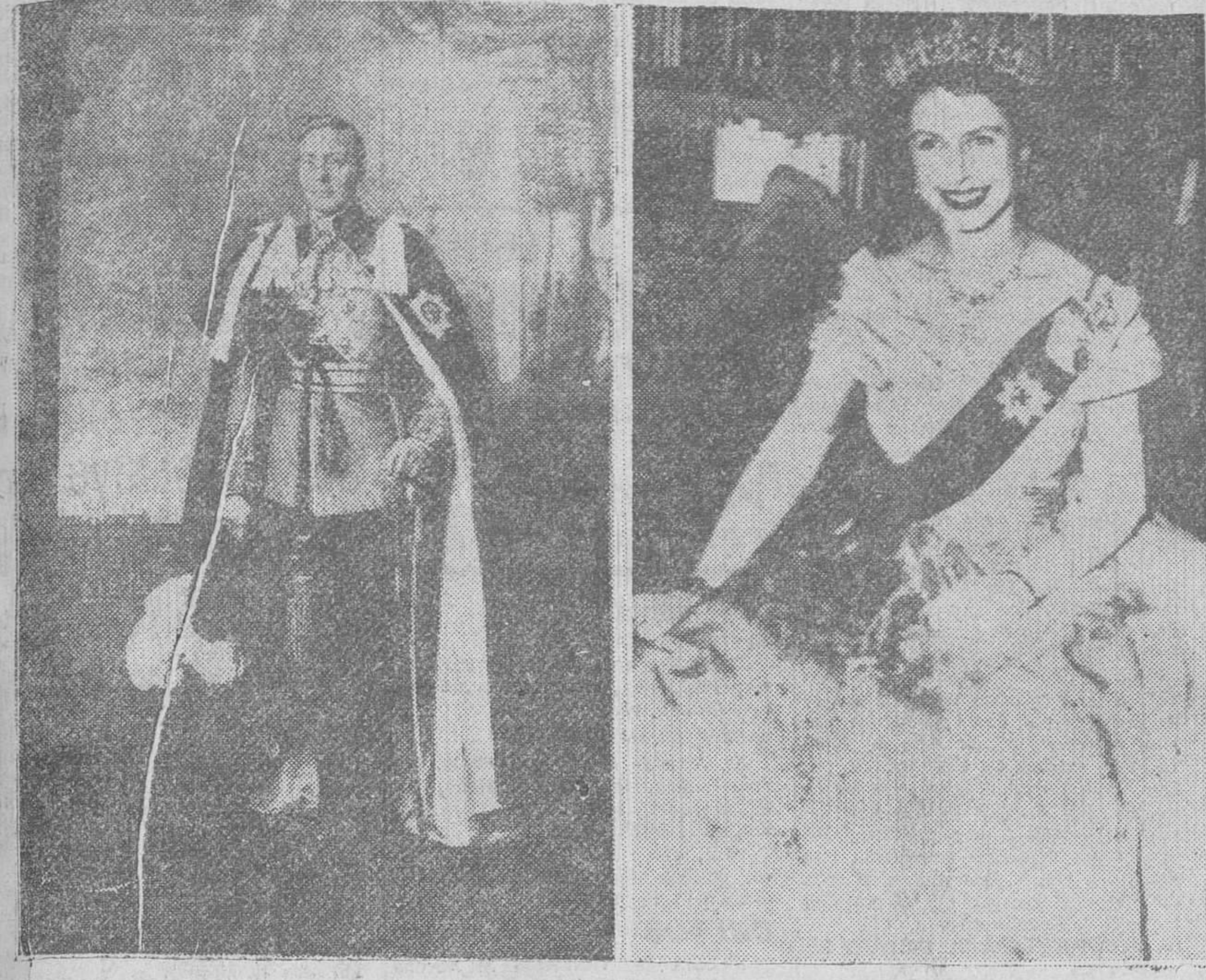
Jorge VI, fallecido ayer