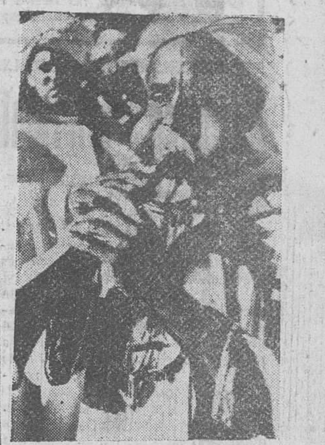
El general Guillaume, residente general en el Marruecos francés, ha girado una visita oficial al Tafilalet y en cada etapa de su viaje se han reproducido las manifestaciones en su honor. En Eriond, un músico hace sonar su "reita" en honor del general Guillaume. Es digno de resaltar la deformación que sufre su cara.