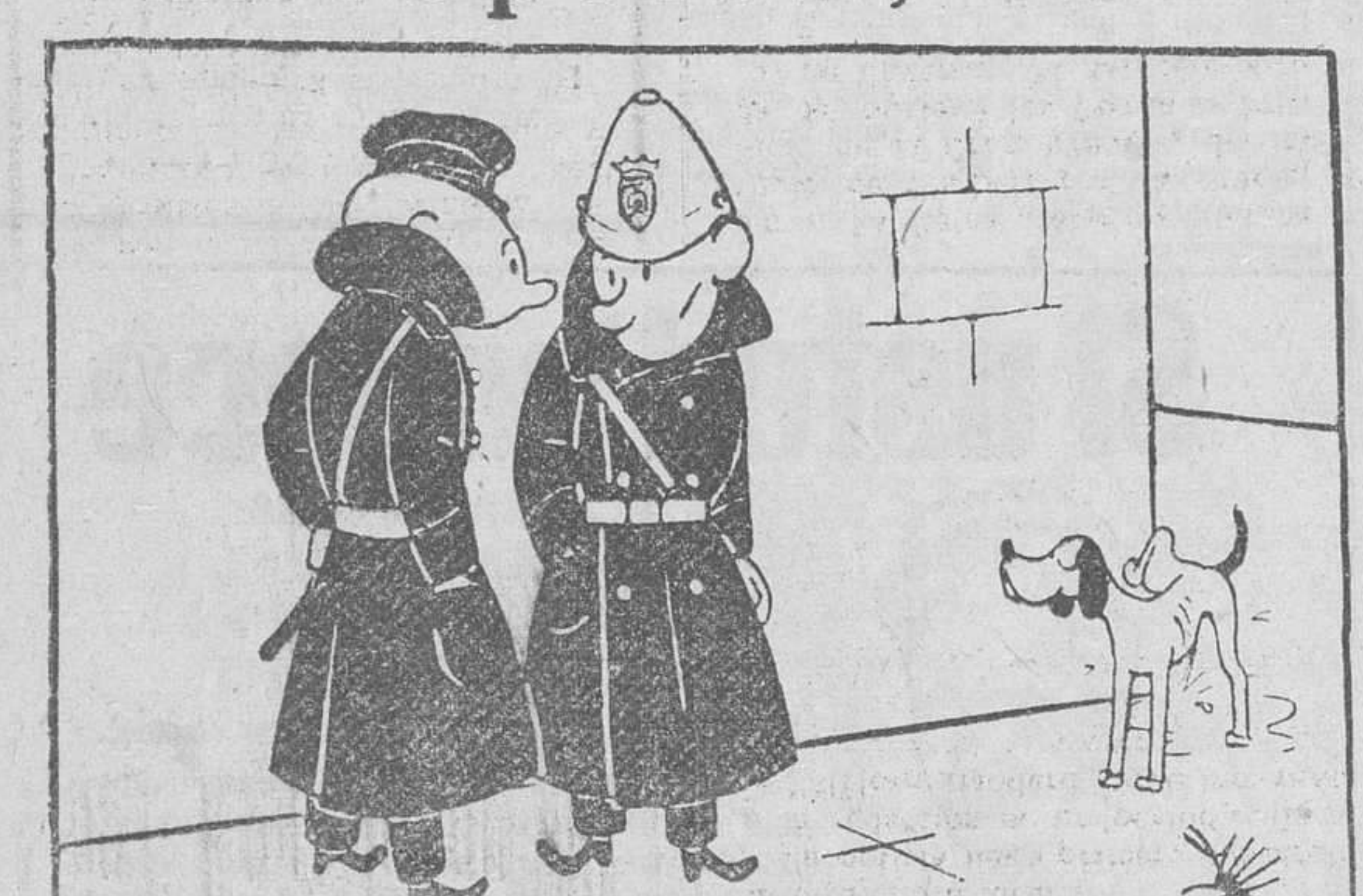
—¡Por fin, un día sin estruendos! —Es que celebran su fiesta los que disparan los cohetes.