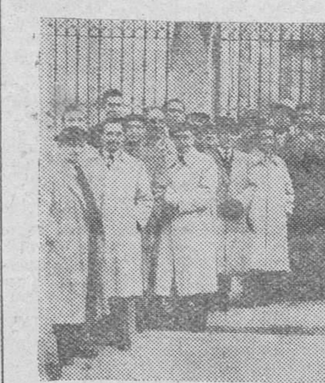
Un grupo de concurrentes a la ceremonia religiosa con que fue conmemorada el domingo en Burgos, la fiesta de San Carlos Borromeo, Patrón del Sindicato de Banca, Bolsa y Ahorro.