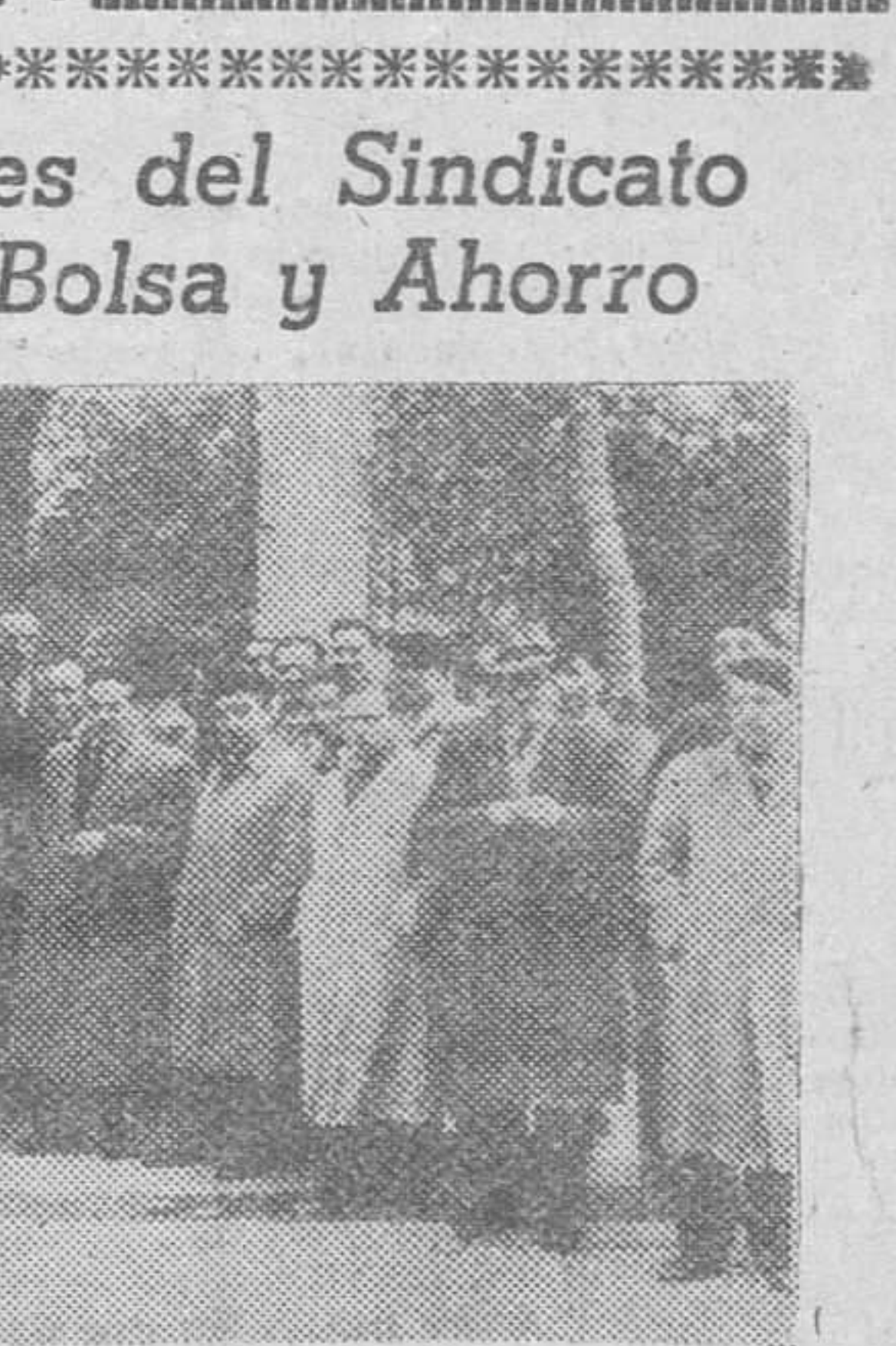
Un grupo de concurrentes a la ceremonia religiosa con que fue conmemorada el domingo en Burgos, la fiesta de San Carlos Borromeo, Patrón del Sindicato de Banca, Bolsa y Ahorro.