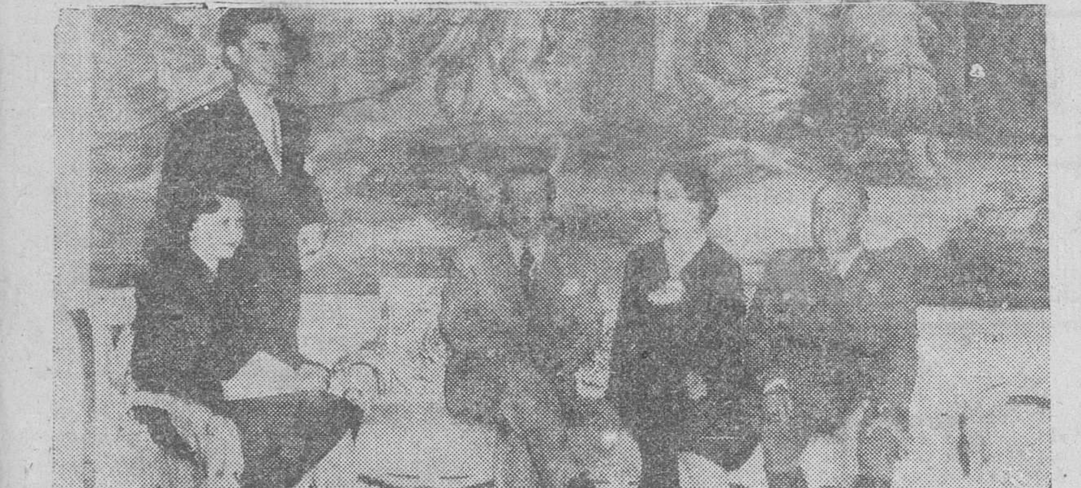
S. E. el Jefe del Estado español, acompañado de su esposa, con el presidente de Filipinas, su hija Victoria y su yerno, momentos después de su llegada al Palacio de El Pardo.

Diversas visitas del egregio huésped a distintas instituciones culturales