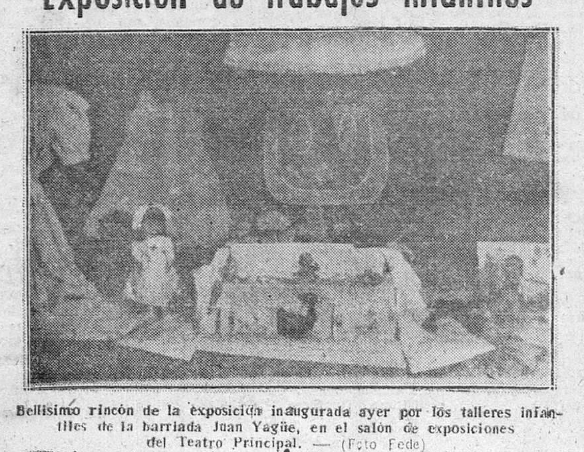
Bellísimo rincón de la exposición inaugurada ayer por los talleres infantiles de la barriada Juan Yagüe, en el salón de exposiciones del Teatro Principal.