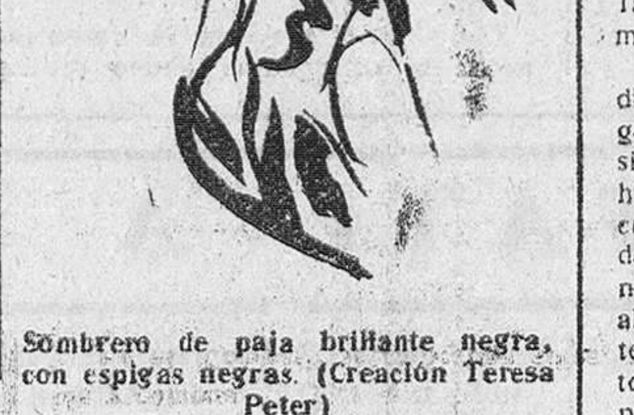
Sombrero de paja brillante negra, con espigas negras. (Creación Teresa Peter)

PARIS.—(Cronica especial para DIARIO DE BURGOS) Tengan ustedes el valor de acordarse, señoras mías, de aquellos tiempos de nuestra hermosa juventud, en los que la obligación de ser una perfecta señorita nos obligaba a servir de te, a las amigas de nuestras madres, presentando la taza con una graciosa reverencia y preguntando de modo respetuoso: "¿Hay algo más?"