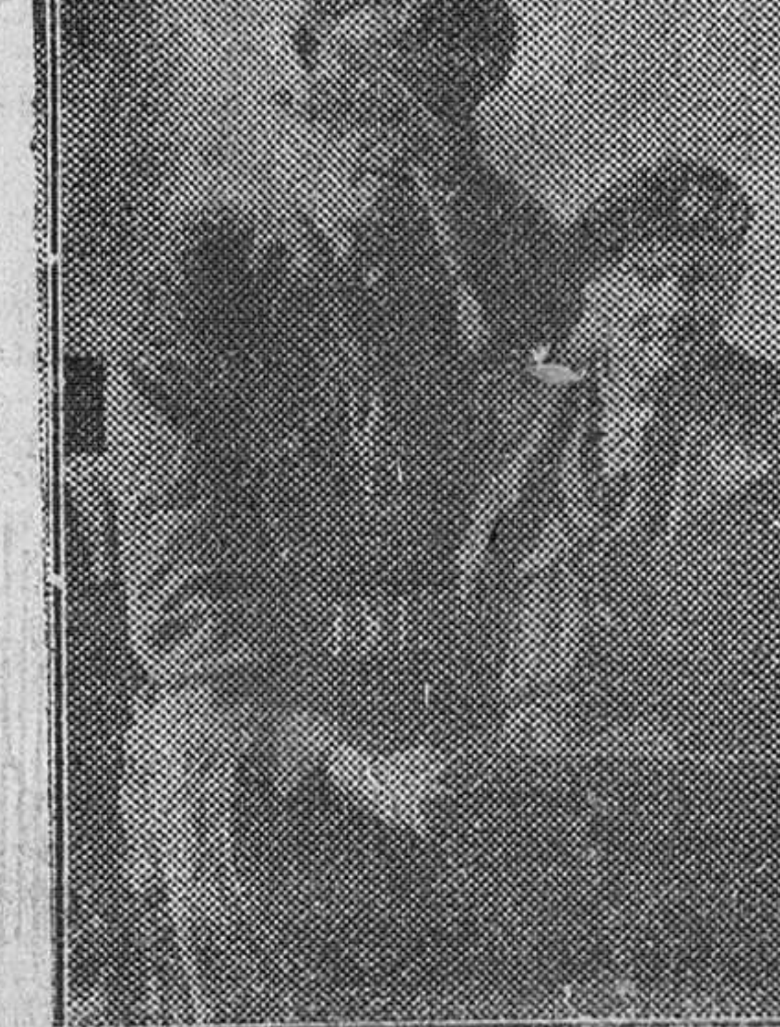
El mariscal Montgomery, comandante supremo del Ejército aliado en Europa, presencia en unión de los miembros de su Estado Mayor, los ejercicios tácticos realizados por las fuerzas del Ejército del Rhin, a las que visitó recientemente.