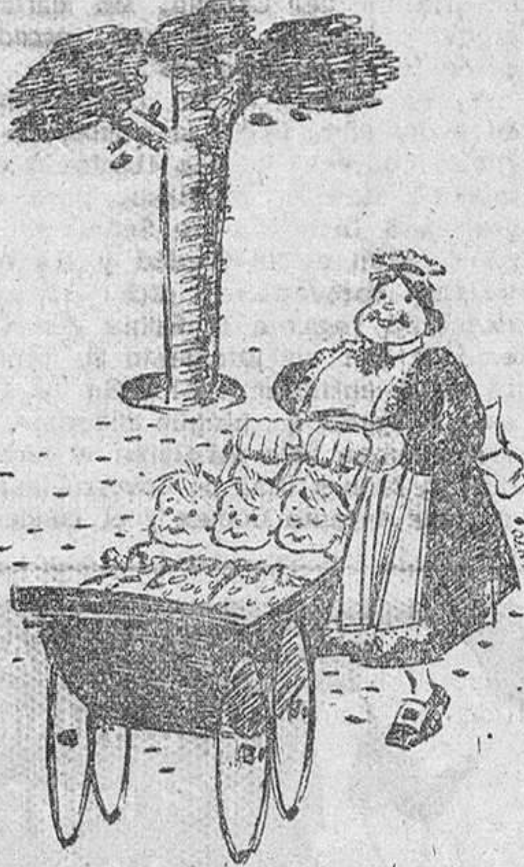
NO IMPORTA LA CRIANZA