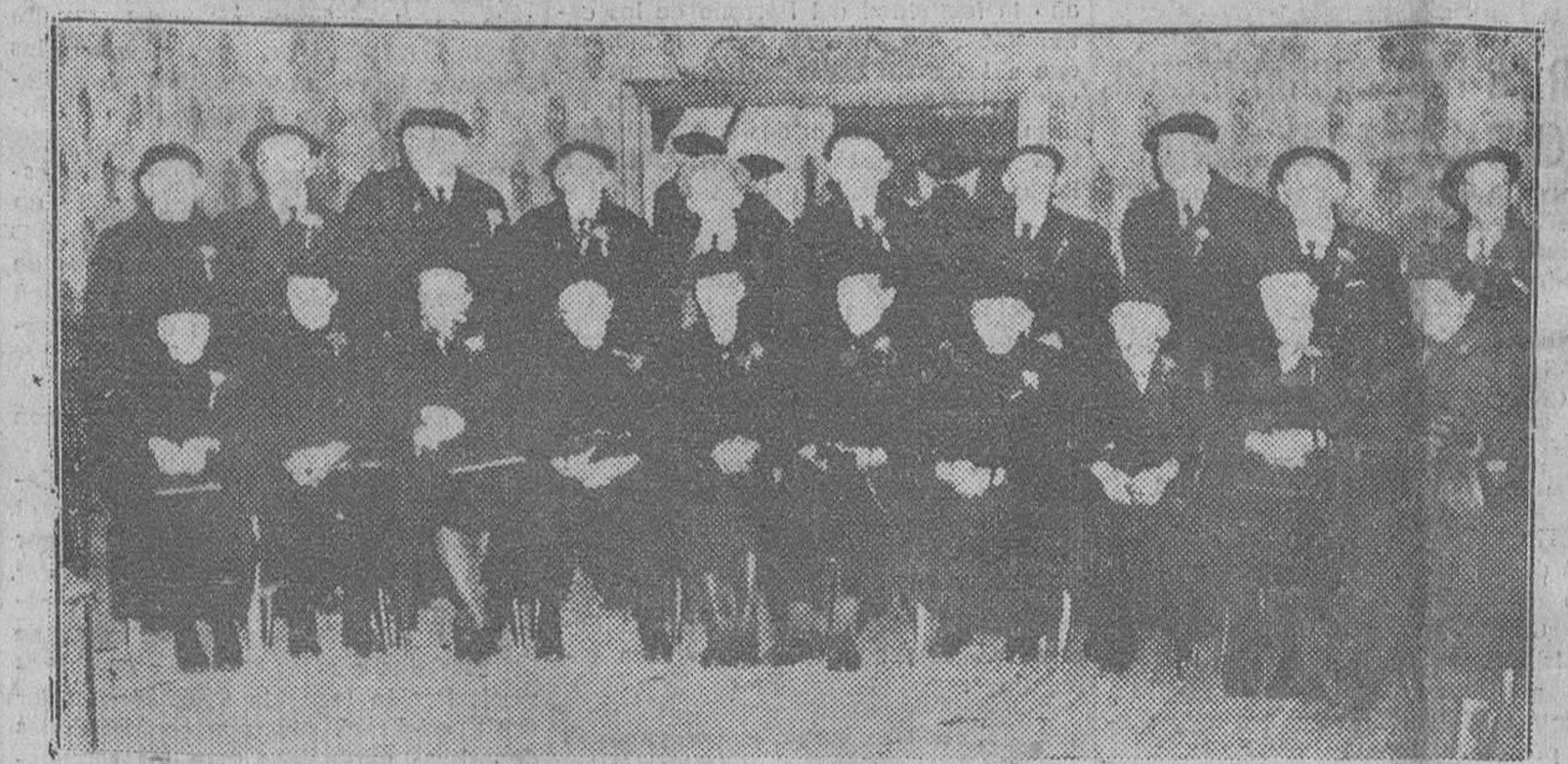
EN LESPERON, FUEBLECITO DE LAS LANDAS DE FRANCIA, QUE SOLO CUENTA 940 HABITANTES, DIEZ MATRIMONIOS HAN CELEBRADO SUS BODAS DE ORO, LO QUE PUEDE CONSTITUIR MUY BIEN UN RECORD MUNDIAL.