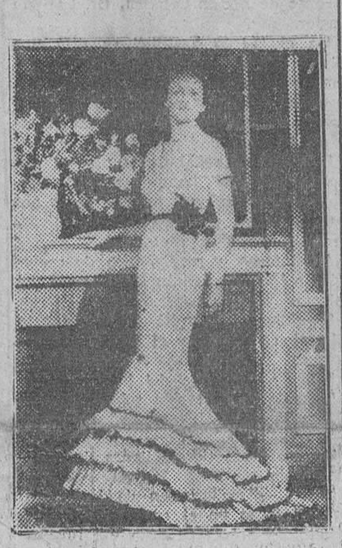
Este vestido de noche, creado por Germaine Lecomte, está confeccionado en tafetán negro en forma de sirena. Un abrigo sin mangas color rojo sangre y adornado con un ramo de grandes amapolas, le presta gran elegancia.

MODAS DE PRIMAVERA Llamamiento árabe a la ONU para que sea estudiado el asunto