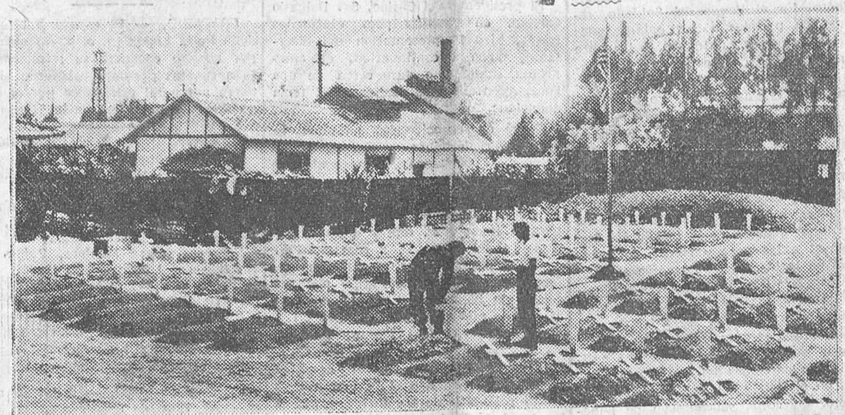
EN UN CEMENTERIO PROVISIONAL CERCA DE TAEU (COREA), SE SUSTITUYEN LOS POSTES INDICADORES POR CRUCES, SOBRE LAS TUMBAS DONDE FUERON INHUMADOS LOS CADAVERES DE SOLDADOS NORTEAMERICANOS, CAIDOS EN LUCHA CONTRA EL COMUNISMO. — (Foto USIS).

Cuando las vanguardias norteamericanas se replegaban gigantesco incendio iluminaban el espacio en la noche del lunes al martes.—Efe. PYONGYANG, TOTALMENTE ABANDONADA Con el primer cuerpo de Ejército de las Naciones Unidas.—Según fuentes dignas de crédito se sabe que hoy martes los tres puentes sobre el río Taedong en Pyongyang, han sido volados, lo que indica que la última de las unidades aliadas se ha retirado del sector de la que en otros tiempos fue capital norteamericana.—Efe. SON CERCA DE 20.000 LOS CERCADOS Tokio.—A la una y media de la tarde, la situación militar en Corea puede (Pasa a última página)