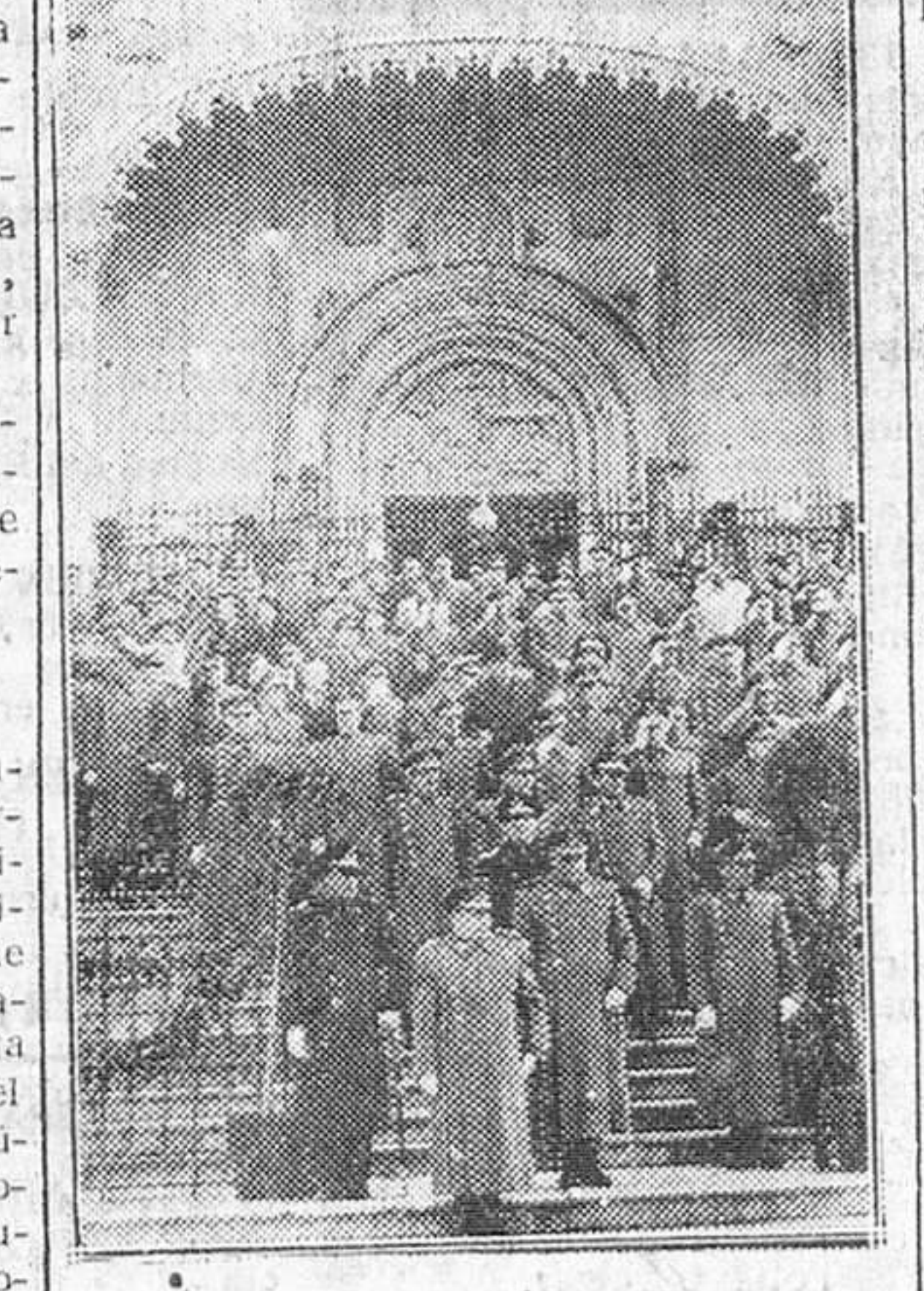
Los ministros del Ejército, Marina y Obras Públicas con los generales y jefes que asistieron a la solemne ceremonia religiosa en la Iglesia de San Jerónimo en honor de Santa Bárbara, Patrona del Arma de Artillería.