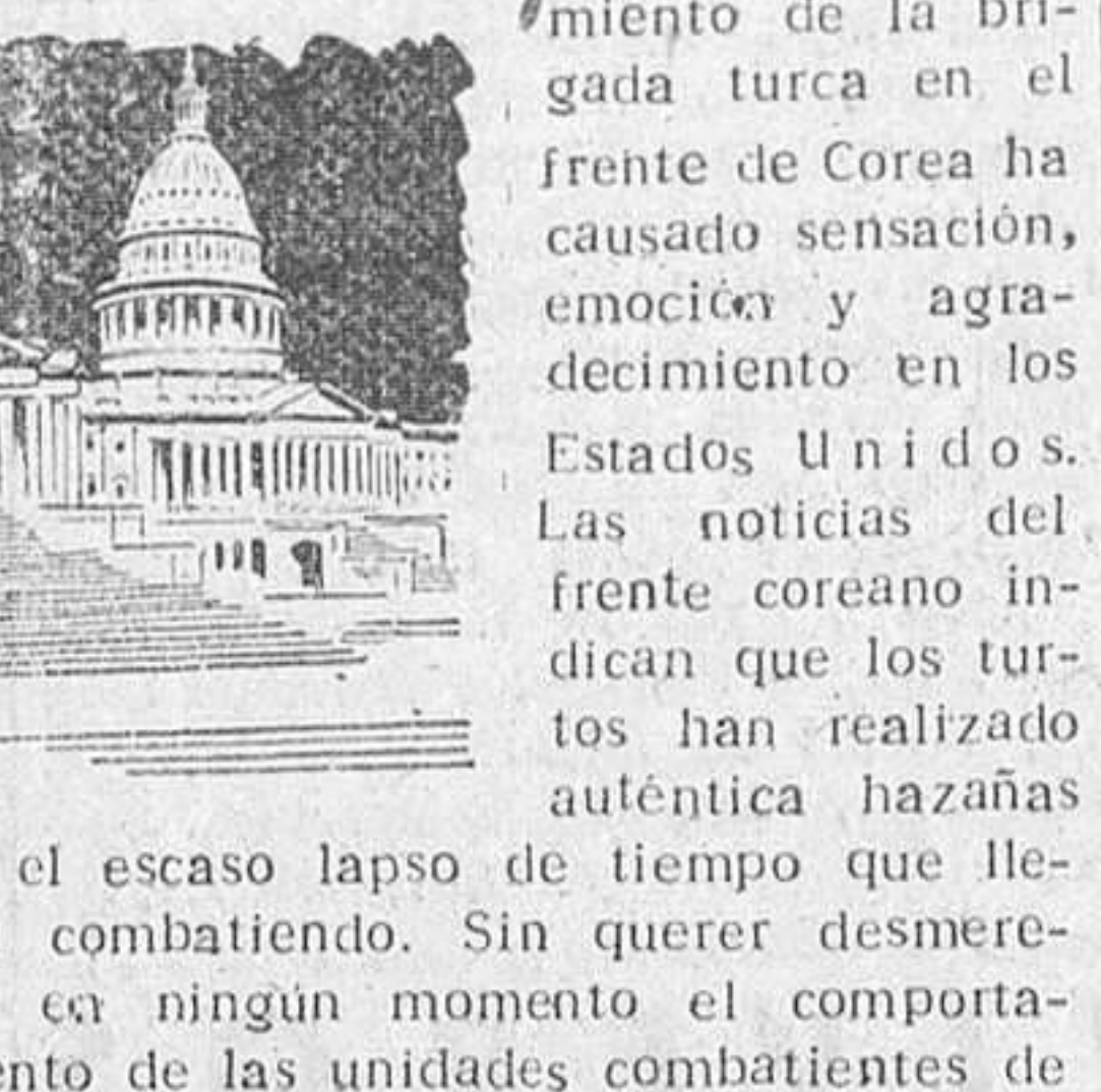
WASHINGTON. (Crónica especial para DIARIO DE BURGOS).

Sensación, emoción y gratitud en Norteamérica