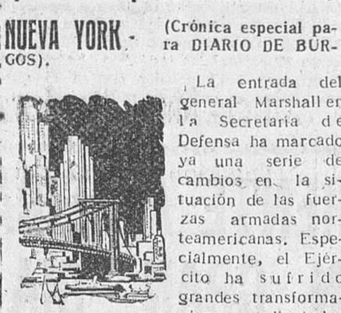
NUOVA YORK. (Crónica especial para DIARIO DE BURGOS).

Podrá atender rápida y eficazmente a las necesidades que se presenten en cualquier parte del Mundo