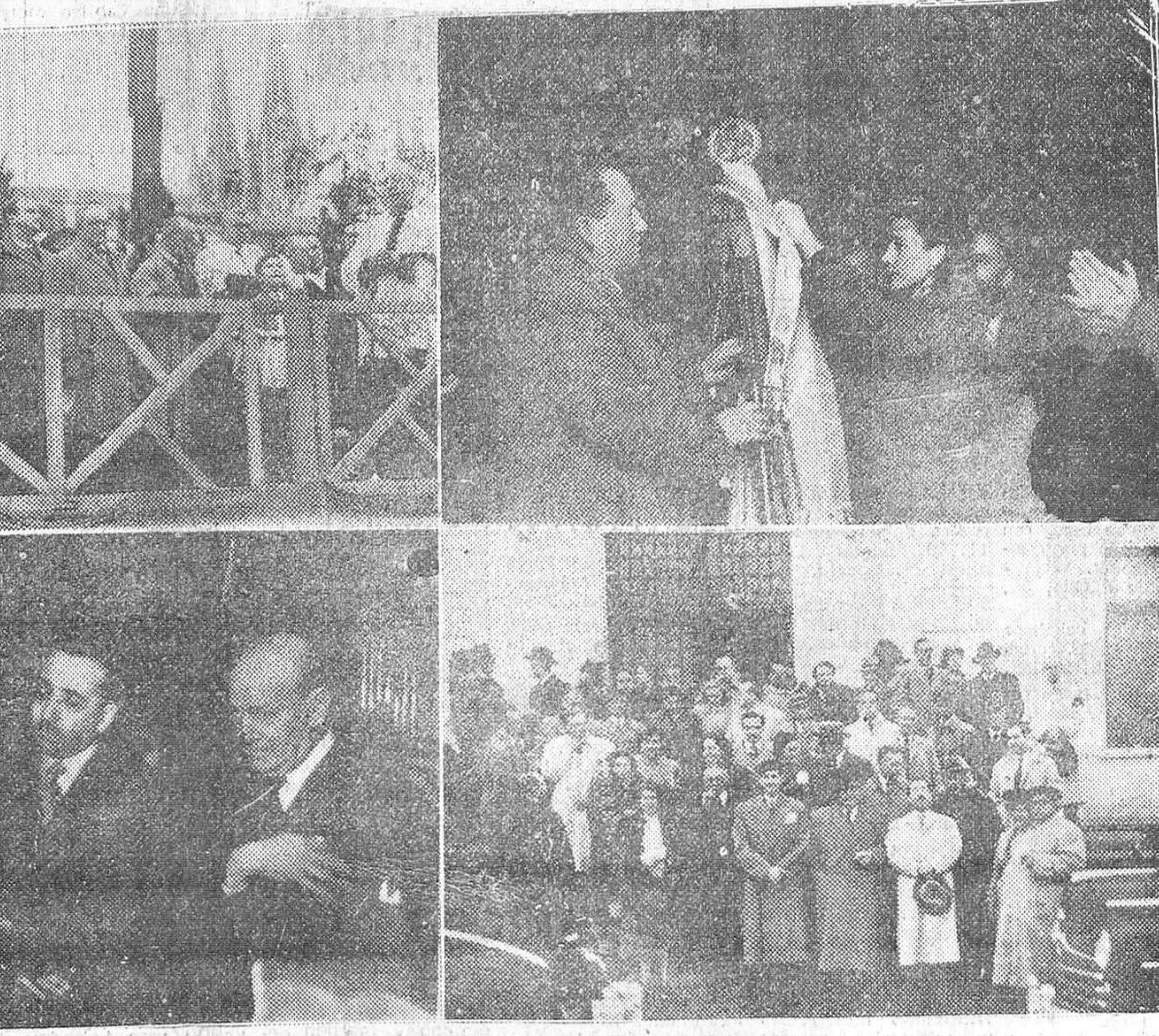
LA JORNADA DEL DOMINGO ULTIMO, FUE PRODIGA EN SEÑALADOS ACONTECIMIENTOS EN LA VIDA LOCAL. "FEDE" CAPTO EL REPORTAJE GRAFICO QUE ILUSTRAS NUESTRAS PAGINAS, DE LOS DIVERSOS ACTOS CELEBRADOS. DE IZQUIERDA A DERECHA, LAS AUTORIDADES ASISTIENDO A LA BENDICION DE LA ESTATUA DEL SACRADO CORAZON DE JESUS, COLGADA EN EL REMATE DE LA TORRE DE LA MERCED. A CONTINUACION, MOMENTO EN QUE AL BANDERIN DEL CLUB CICLISTA SE LE IMPONE UNA CORBATA PERPETUANDO LA FECHA DE LA RECEPCION DE LA MEDALLA AL MERITO, CON LA CUAL HA SIDO DISTINGUIDA LA VETERANISIMA Y ENTUSIASTA SOCIEDAD. ABAJO, EL ALCALDE DE LA CIUDAD, DIRIGIENDOSE A LOS MIEMBROS DE LA UNION POSTAL, DURANTE LA RECEPCION CELEBRADA EN LA CASA CONSISTORIAL. POR ULTIMO, ESTOS MISMOS CONGRESISTAS A LA SALIDA DE LA RESIDENCIA MILITAR DONDE FUERON OBSEQUIADOS CON UN ALMUERZO.