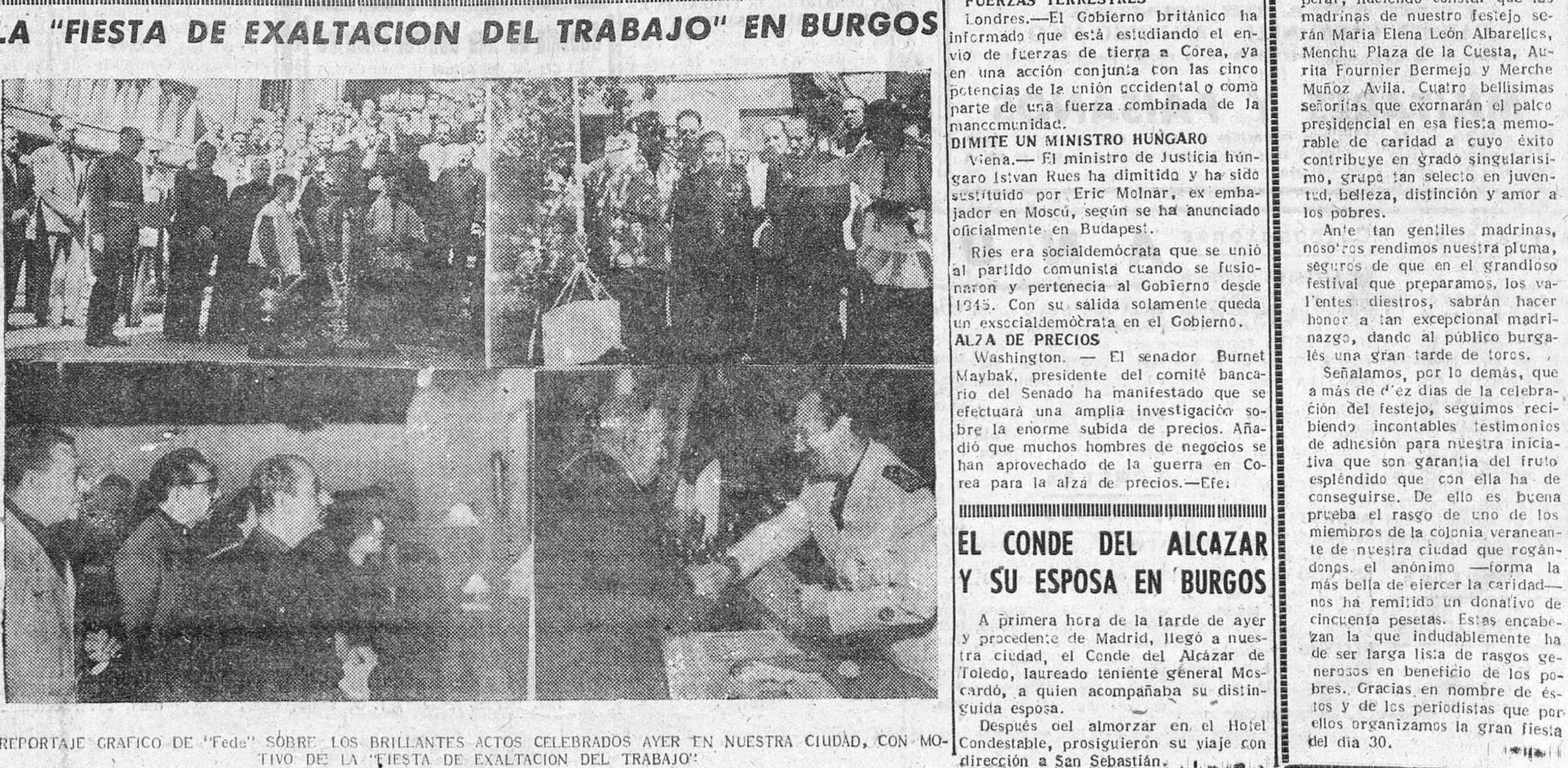
REPORTAJE GRAFICO DE "Fede" SOBRE LOS BRILLANTES ACTOS CELEBRADOS AYER EN NUESTRA CIUDAD, CON MOTIVO DE LA FIESTA DE EXALTACION DEL TRABAJO

Madrid.— El diario "Ya", publica esta mañana unas interesantes declaraciones del ministro de Educación Nacional, en las que, entre otras cosas, ha dicho que están en estudio los proyectos de obras para construir en España una emisora de televisión y aparatos receptores para este moderno sistema de difusión. Además dentro del plan nacional de radiodifusión que lleva a cabo la Dirección General de este servicio, y del que ha sido prueba la instalación durante este año de la emisora de Valencia, se están montando en Madrid cuatro emisoras de 100 kilovatios cada una, que permitirán llenar los servicios europeos de Ultramar con gran amplitud. Hay que tener en cuenta que la actual emisora de onda corta de Arganda dispone de una potencia de 40 kilovatios.