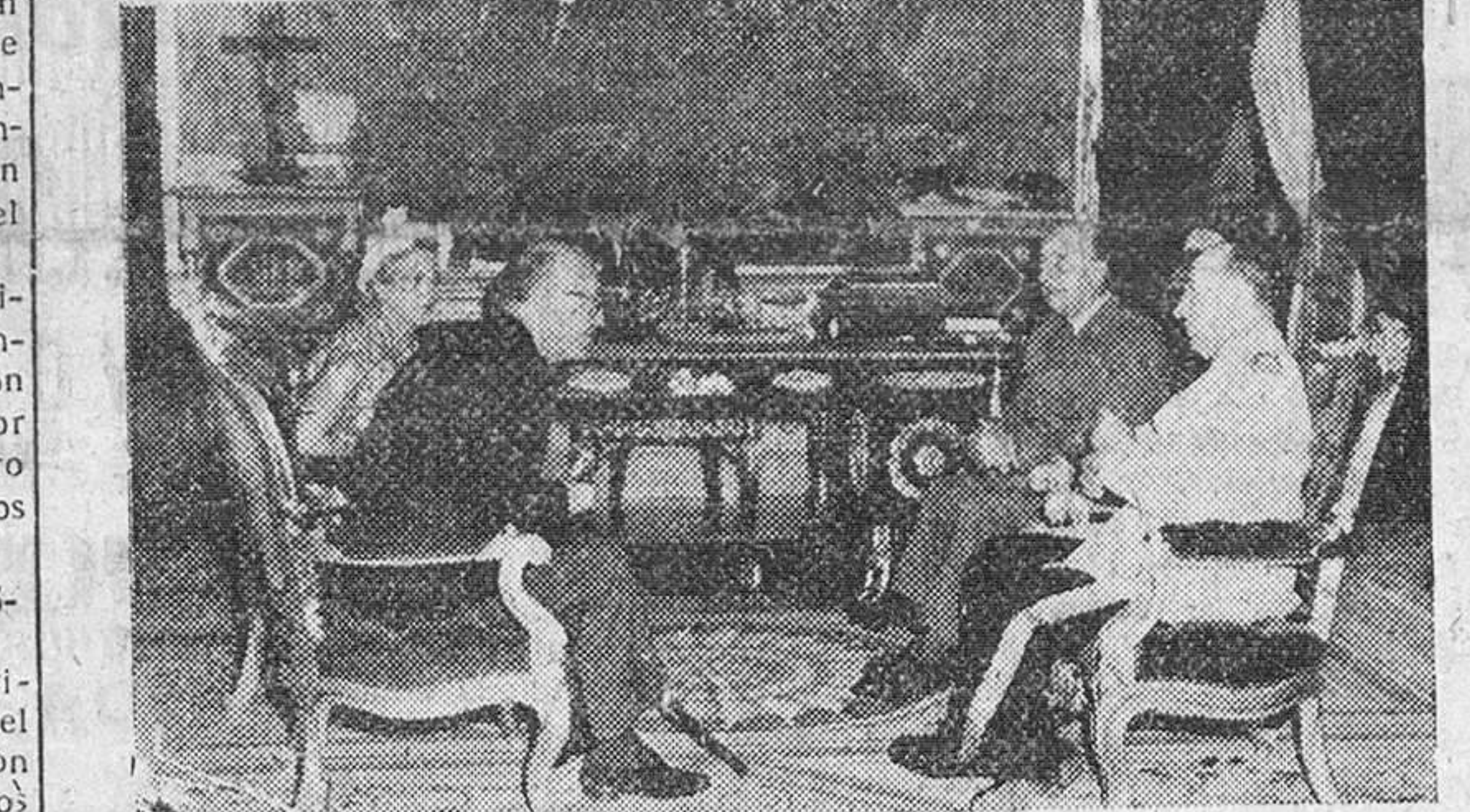
MADRID.— S. E. EL JEFE DEL ESTADO ACOMPAÑADO DE MR. FLOYD B. ODLUM, PRESIDENTE DE "ATLAS CORPORATION" Y DE LA ESPOSA DE ESTE, MRS. JACQUELINE COCHREN, A QUIENES RECIBIO EN EL PALACIO DE EL PARDO.