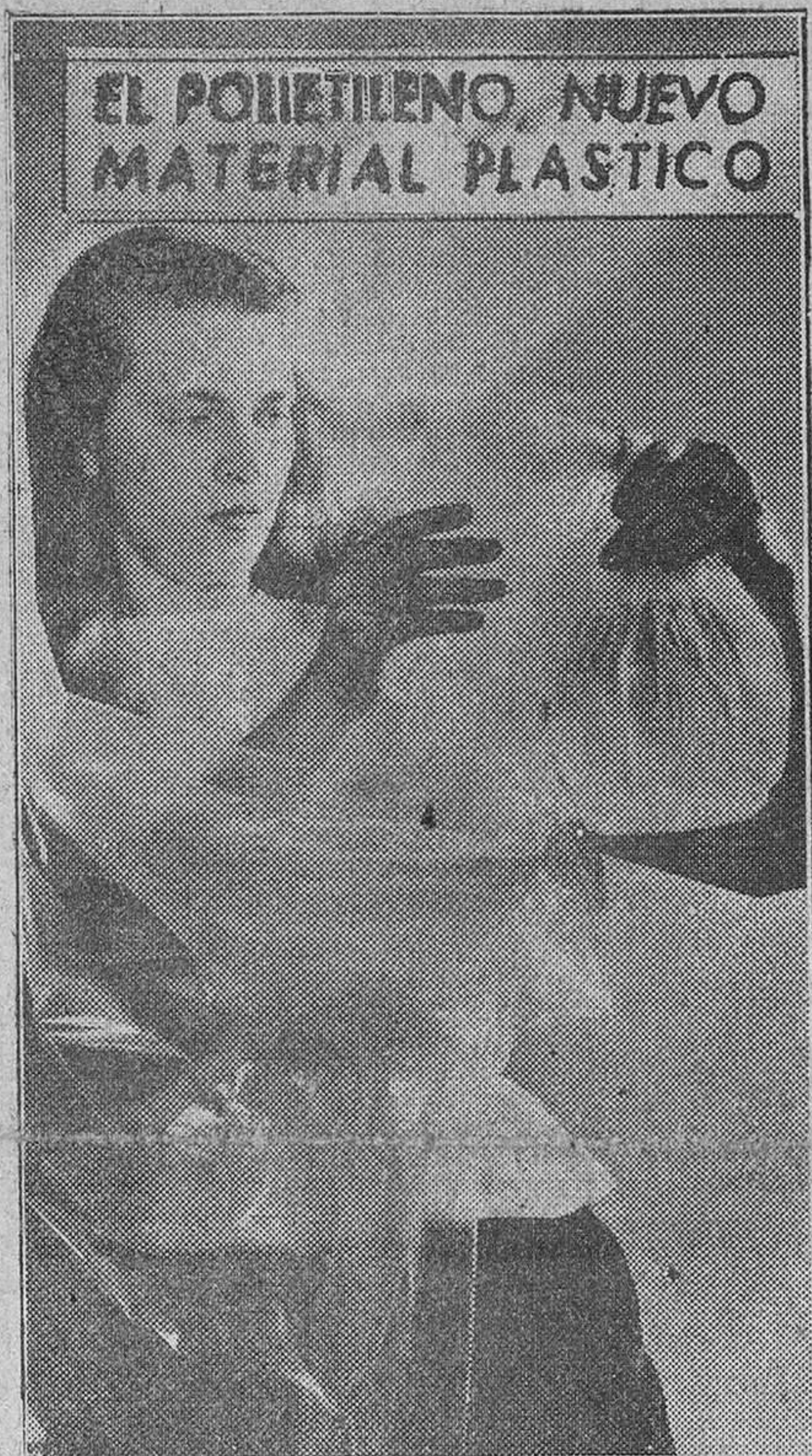
El etileno es una sustancia empleada desde 1923 en Estados Unidos como anestésico y también para acelerar la madurez de las frutas y que ahora, al ser polimerizado, es decir, convertida en materia resinosa, ha creado el polietileno, material plástico de gran aplicación, que puede emplearse en la fabricación de botellas, tapones, zarcos, bolsos e incluso tubos de drenaje. Este nuevo producto es el material plástico más ligero y flota en el agua, reblandeciéndose a una temperatura algo menor que el punto de ebullición. Una de sus características más destacadas es que carece de reactividad con los otros productos químicos, es insoluble a temperaturas ordinarias en los disolventes normales y el vinagre, el jugo de limón y la acetona no dejan huella en él. Su flexibilidad e impermeabilidad, así como su falta de sabor y olor le han hecho indicadísimo como material para envolver, como nos muestra la precedente fotografía, en la que esta bella muchacha ha improvisado una bolsa para preservar un producto.

Bruselas.—La policía belga tuvo que restablecer el orden esta mañana en el centro de Bruselas, cuando grupos de estudiantes de la Universidad trataron de impedir que se celebrara una reunión en apoyo del ingreso al Trono del Rey Leopoldo III.—Efe.