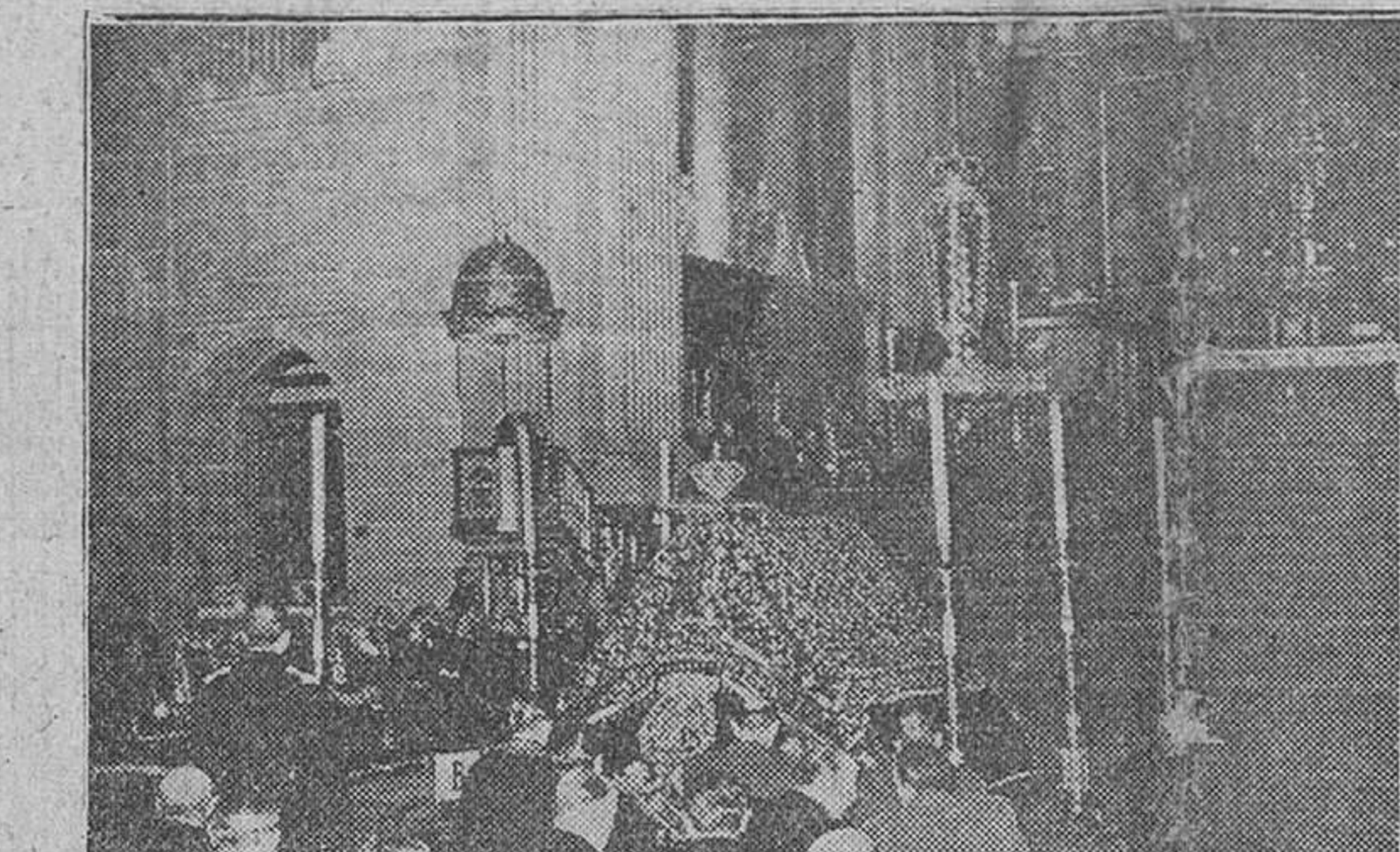
San Lorenzo de El Escorial.—Con asistencia de S. E. el Jefe del Estado, Generalísimo Franco, y Gobierno español, se han celebrado en el Real Monasterio solemnes funerales en sufragio del alma de S. M. el Rey D. Alfonso XIII y de todos los Reyes de las dinastías españolas. La fotografía recoge un momento de dichos funerales con el túmulo en el centro.