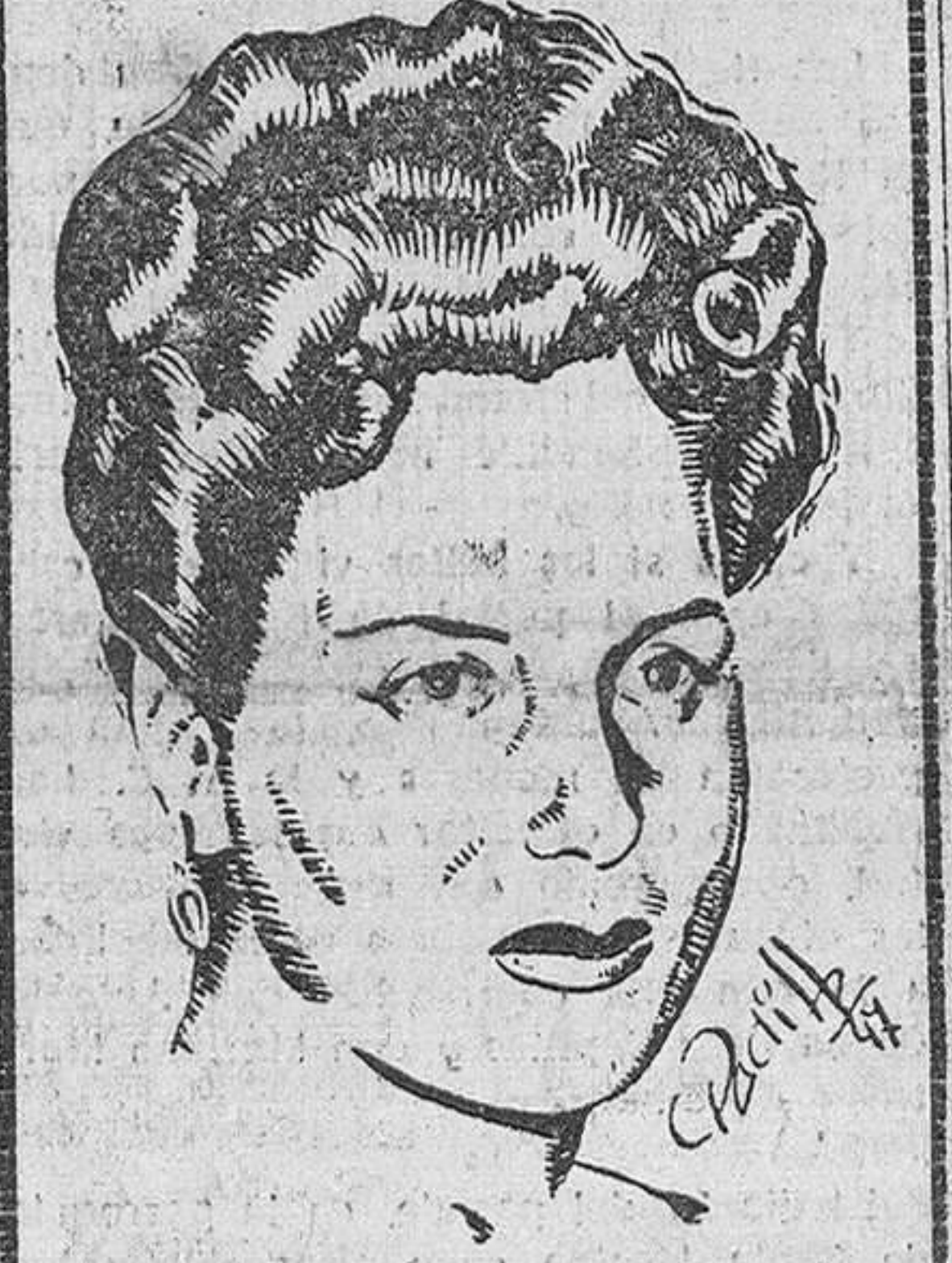
Buenos Aires.—Doña Eva Duarte de Perón, esposa del presidente argentino, ha sido operada hoy de apendicitis.