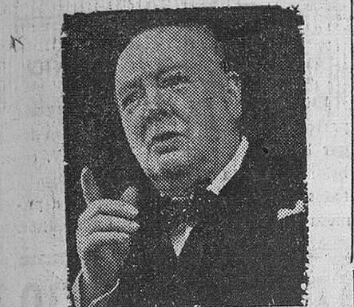
Funchal (Madera).—Winston Churchill, ha salido en avión con dirección a Londres, para dirigir la campaña electoral del partido conservador.

Los laboristas iniciarán la campaña electoral el próximo 3 de Febrero, en que será disuelto el Parlamento inglés