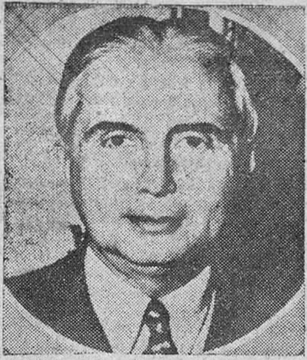
EL PRESIDENTE OSPINA

OSPINA ANUNCIA SIN EMBARGO QUE LAS ELECCIONES SE CELEBRARAN EL PROXIMO DIA 26