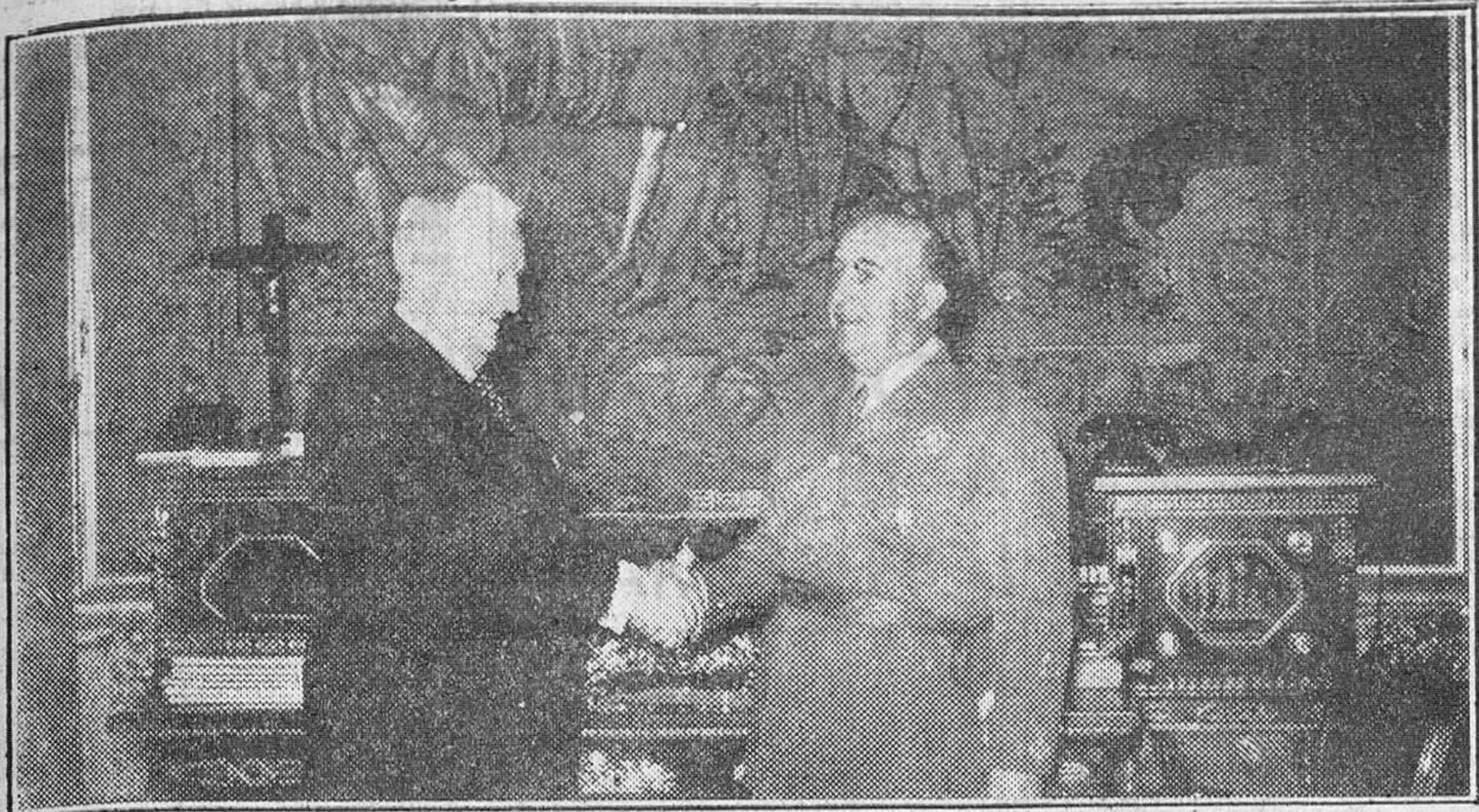
Madrid. -- S. E. el jefe del Estado ha recibido en audiencia celebrada en el Palacio de El Pardo, al senador norteamericano Mac Carran, con quien sostuvo una larga y cordial conversación.