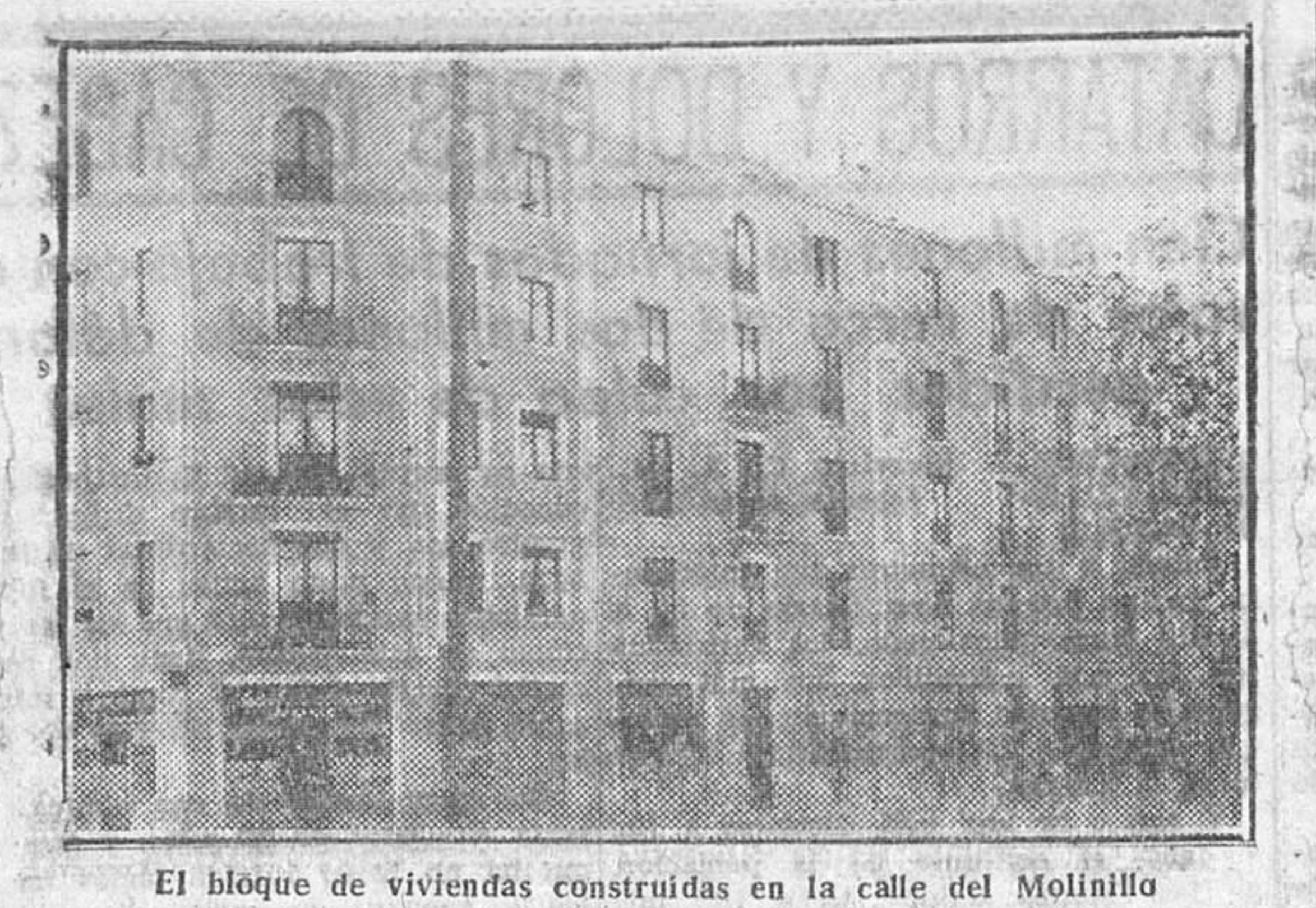
El bloque de viviendas construidas en la calle del Molinillo

Sobre las líneas generales esbozadas, la Caja de Ahorros del Círculo Católico de Obreros, se enfrenta, como digo, optimista, con el porvenir. Aparte las operaciones y actividades descritas es su propósito efectuar tantas obras sociales y ampliaciones de servicios cuantas permitan las imposiciones en ella efectuadas, de acuerdo con severa adminis-