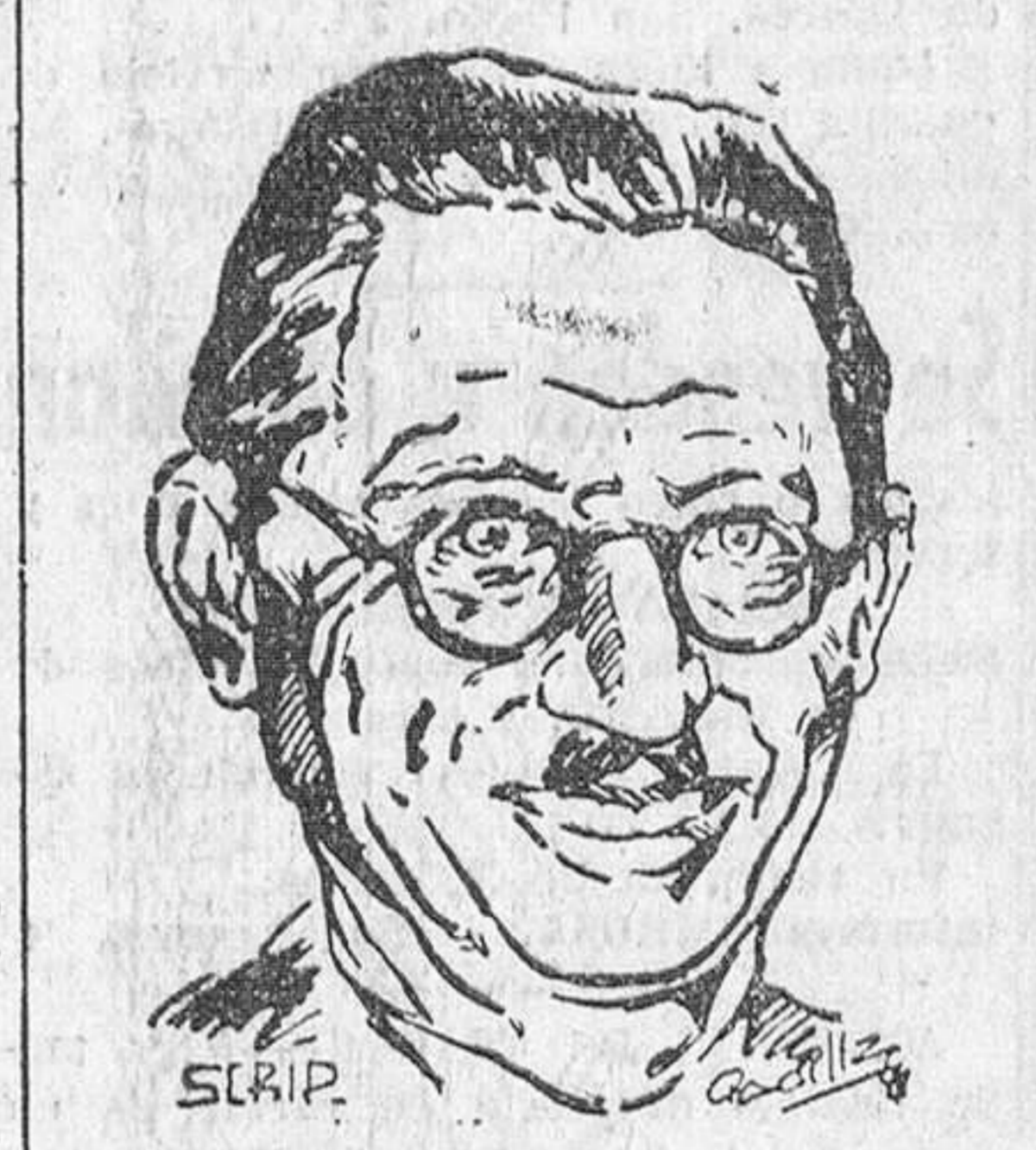
JULES MOCH. Paris.-El presidente de la República Mr. Auriol, ha reanudado a las nueve y media de la mañana sus consultas para resolver la crisis política. A dicha hora recibió en su despacho al presidente del Consejo Andre Marie...

Auriol conferencia con los anteriores presidentes del Consejo de ministros