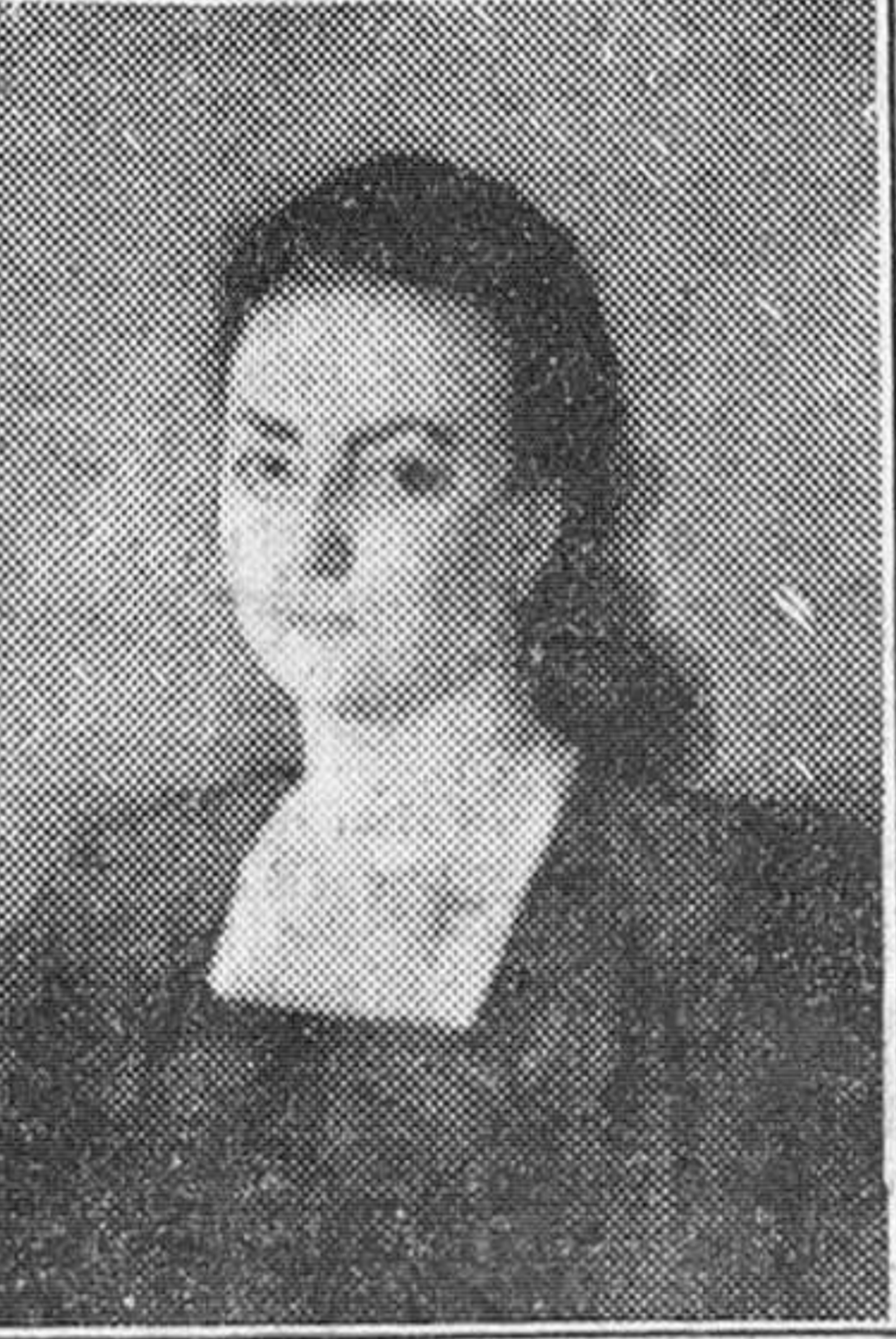
"Carmenchin", uno de los retratos realizados por don Marceliano Santa María durante la actual temporada de verano en Burgos.