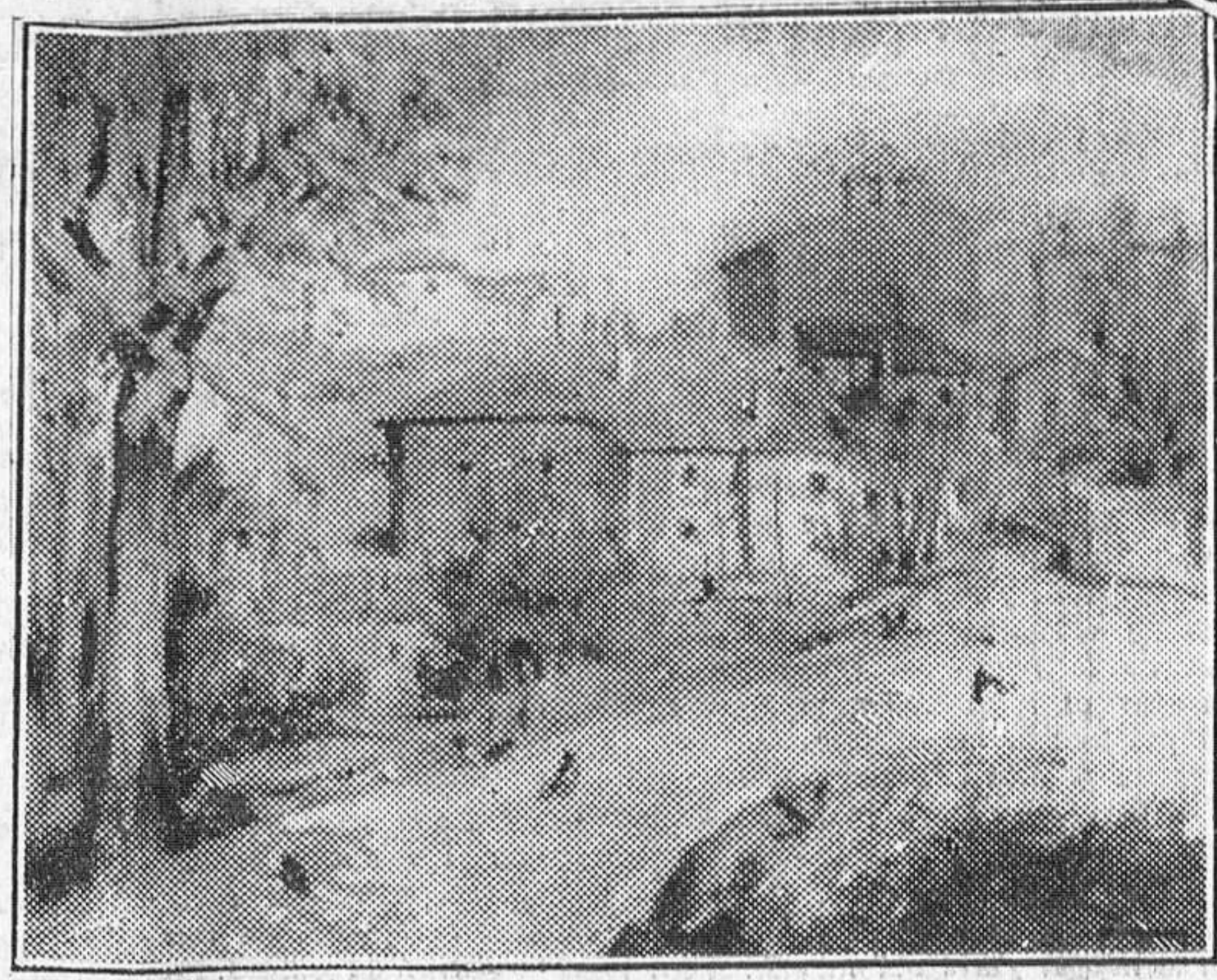
Paisaje titulado "Sarracín", obra del laureado pintor don Marceliano Santa María.

Cada año, el laureado pintor burgalés don Marceliano Santa María, cuando se acerca el verano, recobra una alegría y un vigor excepcionales. Su estudio de la calle de Abel parece desajarsarse, mientras el octogenario artista febrilmente efectúa los preparativos de su viaje a Burgos. Y cuando el momento llega, la penumbra de aquel hotelico contrasta con la profunda emoción de su propietario.