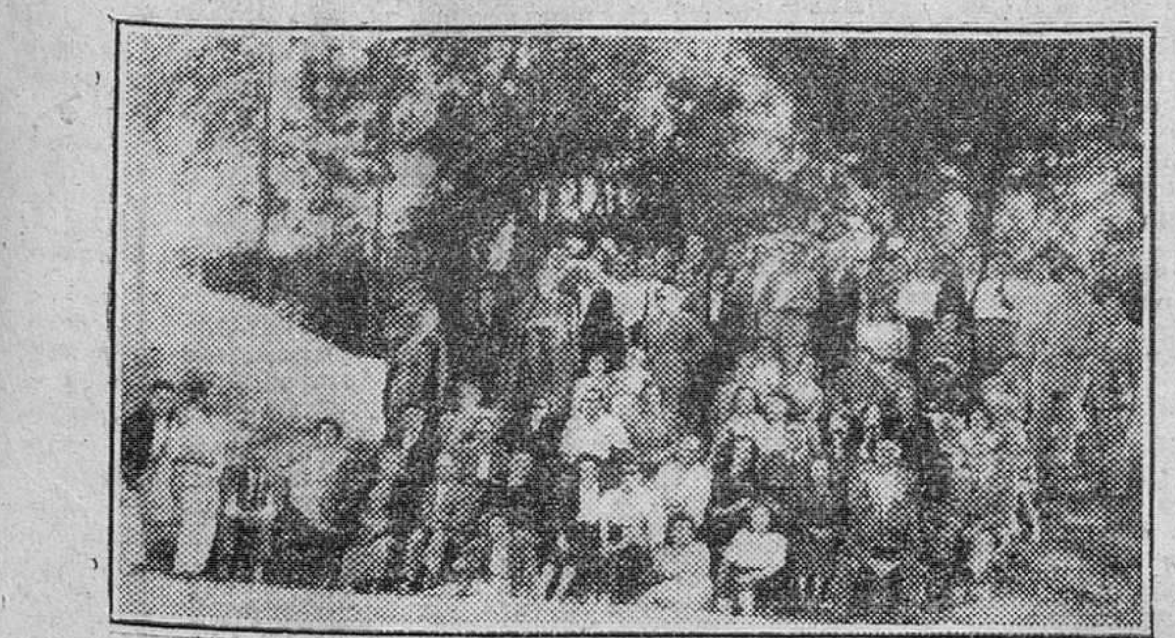
El domingo y lunes último efectuaron un viaje por tierras de la Montaña cerca de un centenar de excursionistas burgaleses, en expedición organizada por la Oficina del Turismo. En nuestra foto, los excursionistas, junto a las famosas Cuevas de Altamira.—Foto FEDE