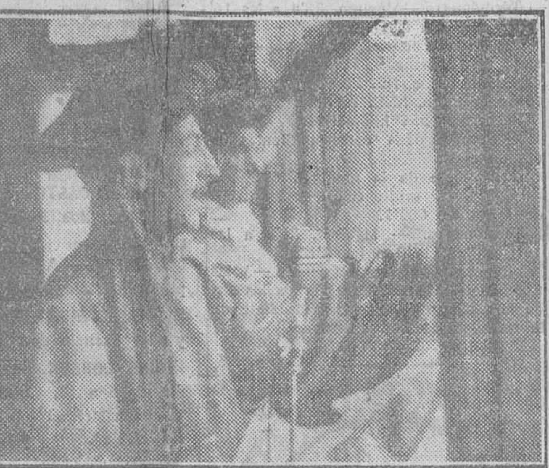
Perspectiva de la Plaza de José Antonio durante la inauguración de las fiestas.