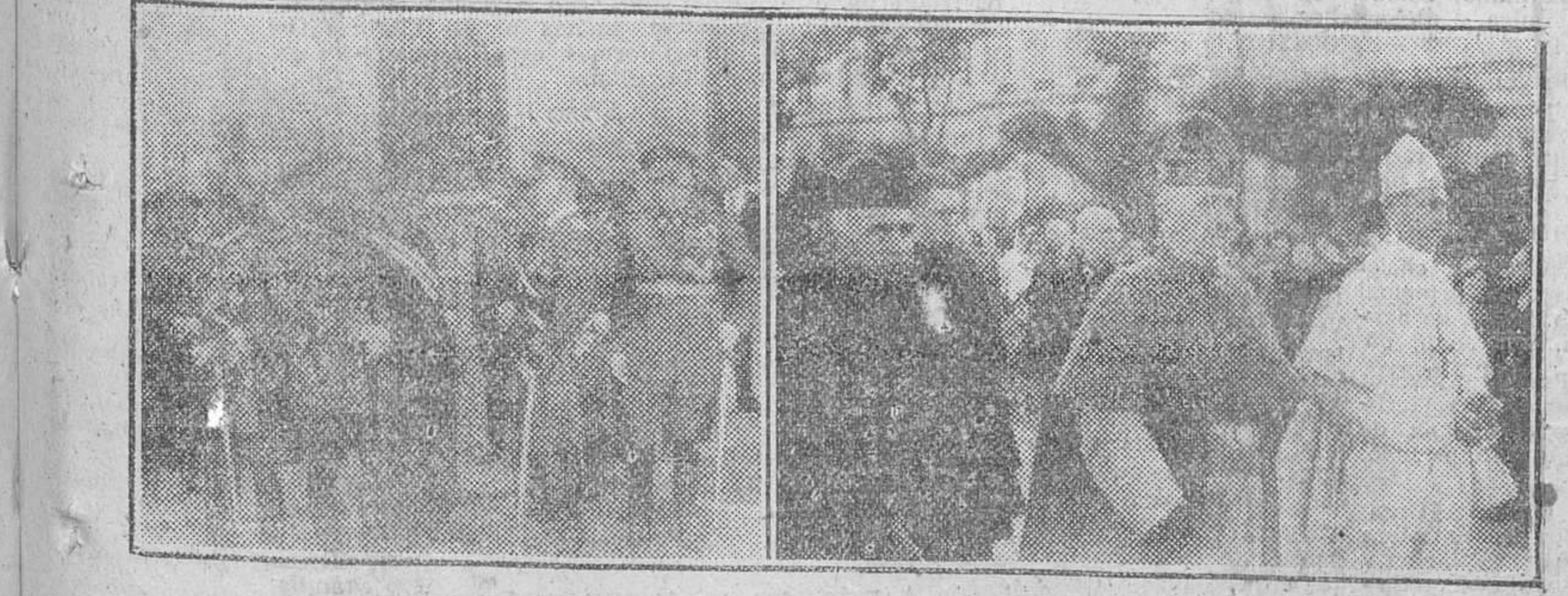
Nuestro Rvmo. Prelado y el Abad Mitrado de Cardena, aparecen en el precedente grabado presidiendo la procesion del Sagrado Corazon de Jesús. A la izquierda, las autoridades militares a la salida de la fiesta del Cuerpo de Sanidad