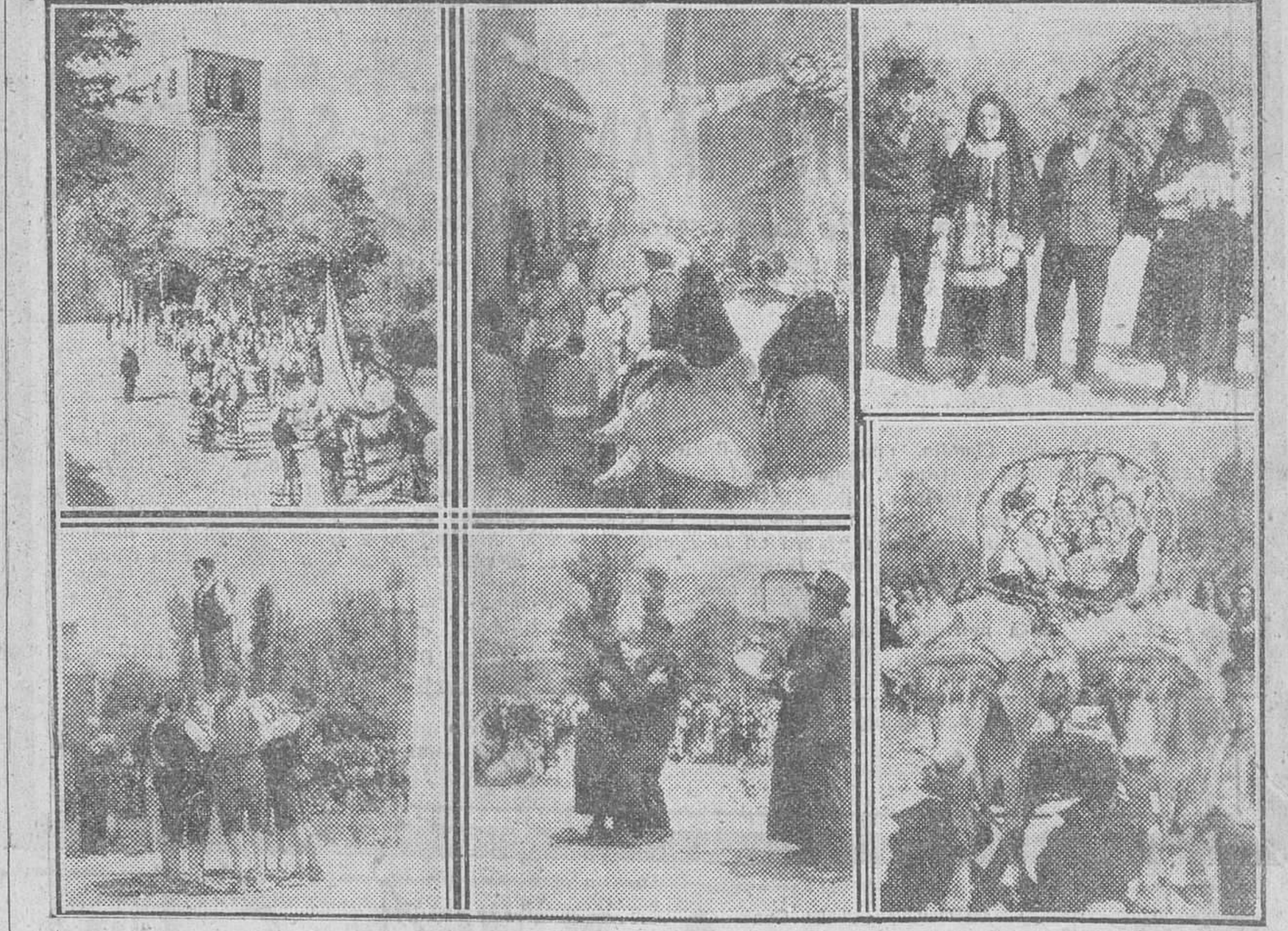
tas y por último la imagen de Nuestra Señora del Rosario.

Tras la llegada del Orfeón se organizó en la iglesia parroquial la solemne procesión que, partiendo de este templo recorrió varias calles de Quecedo para dirigirse luego por la carretera hasta la iglesia del inmediato pueblo de Población. Figuraban en el cortejo los pendones de muchas de las parroquias comarcanas, muchachas y muchachos ataviados con trajes típicos, grupos de danzas participantes en los concursos y los del Orfeón, orfeonistas