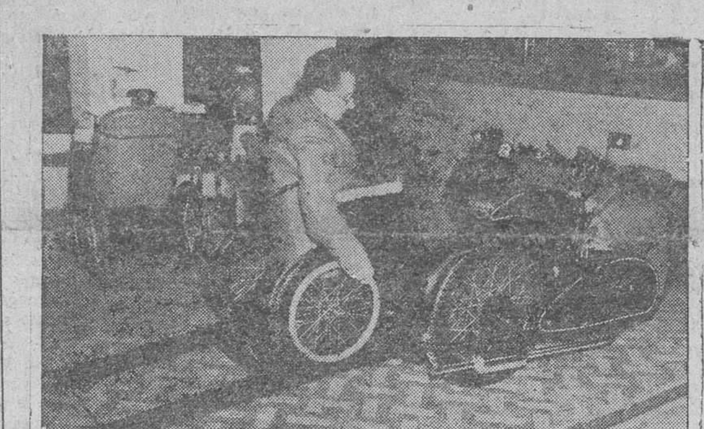
He aquí un modelo combinado de motocicleta y silla para mutilados, de fácil manejo y reducido consumo de carburante, que han comenzado a utilizar con éxito numerosos ex-combatientes británicos.