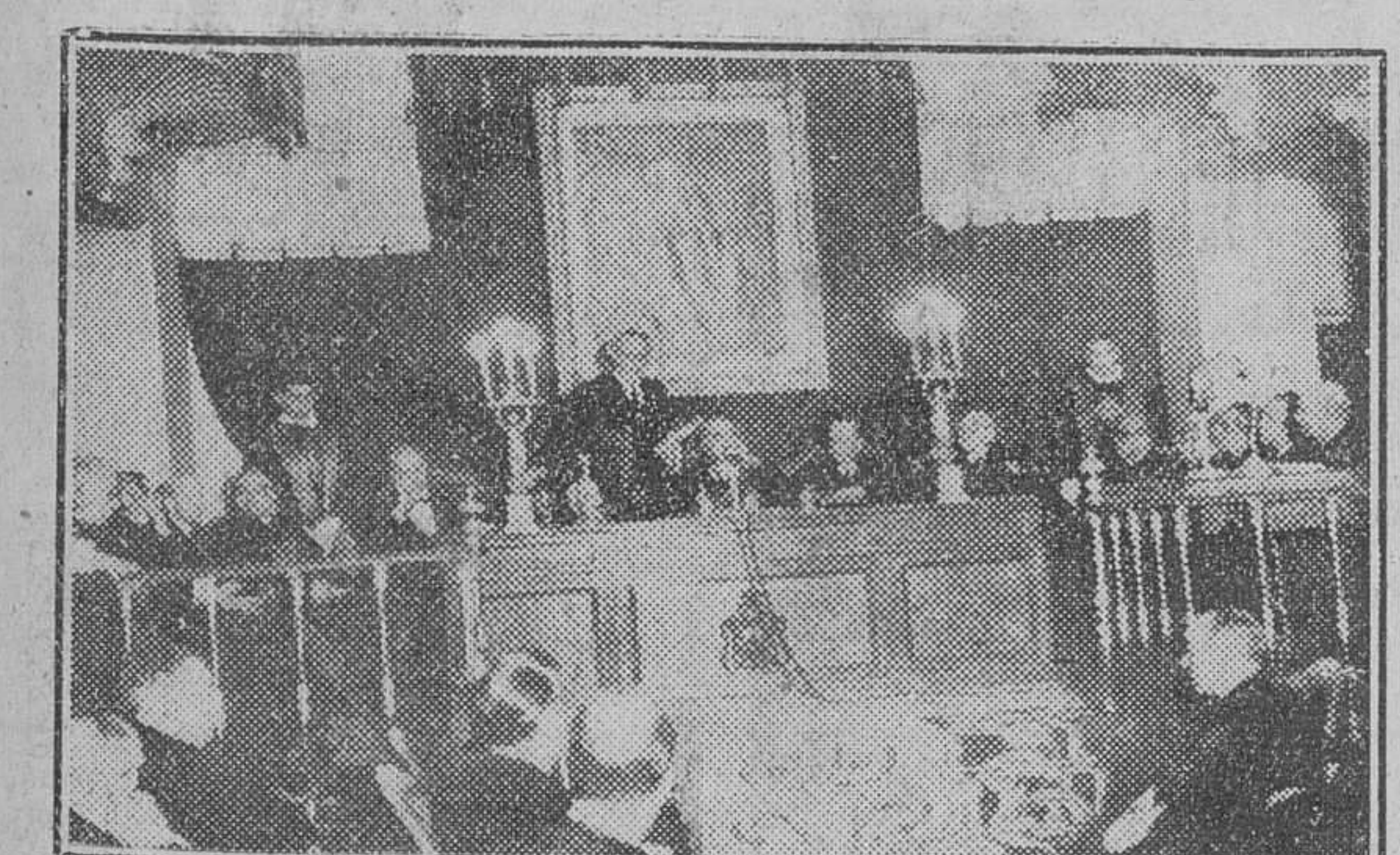
Madrid.—El presidente de las Cortes y de la Academia de Jurisprudencia, pronunció una brillante conferencia sobre "La Idea de la Justicia Social", en la solemne inauguración de curso, a la que asistieron los ministros de Justicia y Obras Públicas.