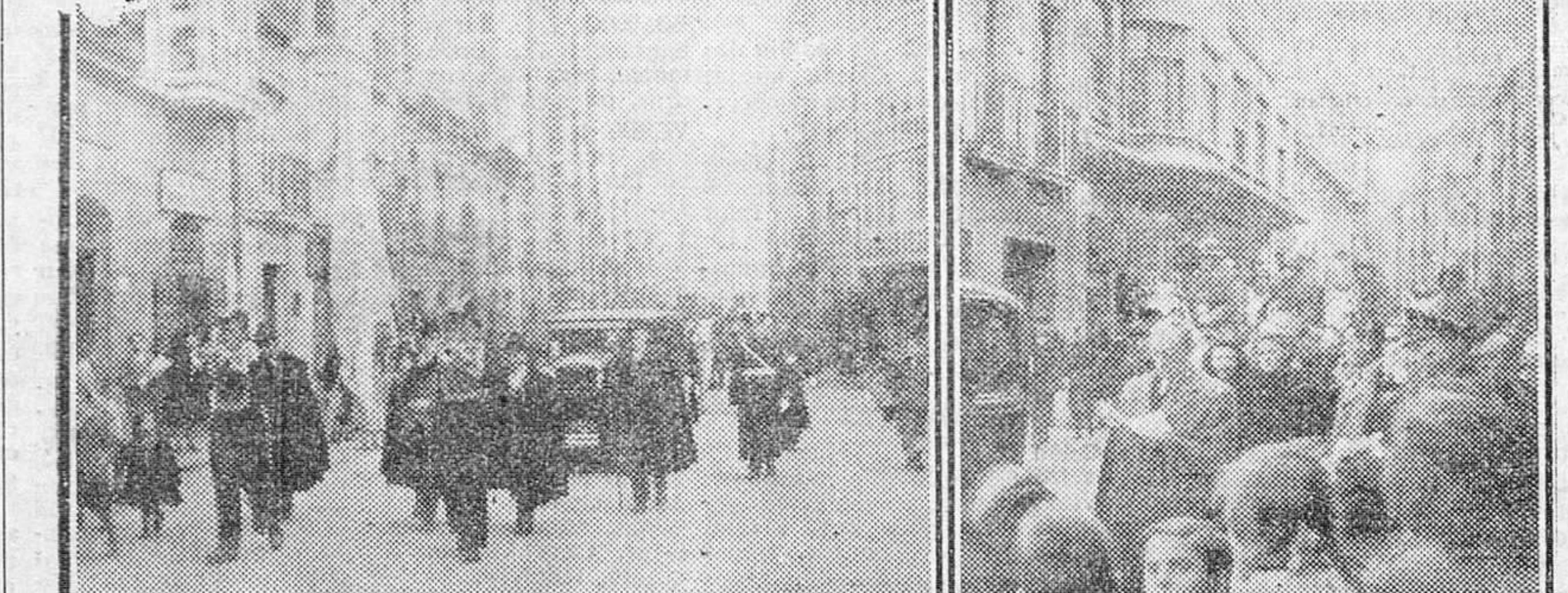
Dos momentos del solemne acto que tuvo lugar en la mañana de ayer en diversas calles de nuestra ciudad, con motivo de la tradicional publicación de la Bula de la Santa Cruzada.