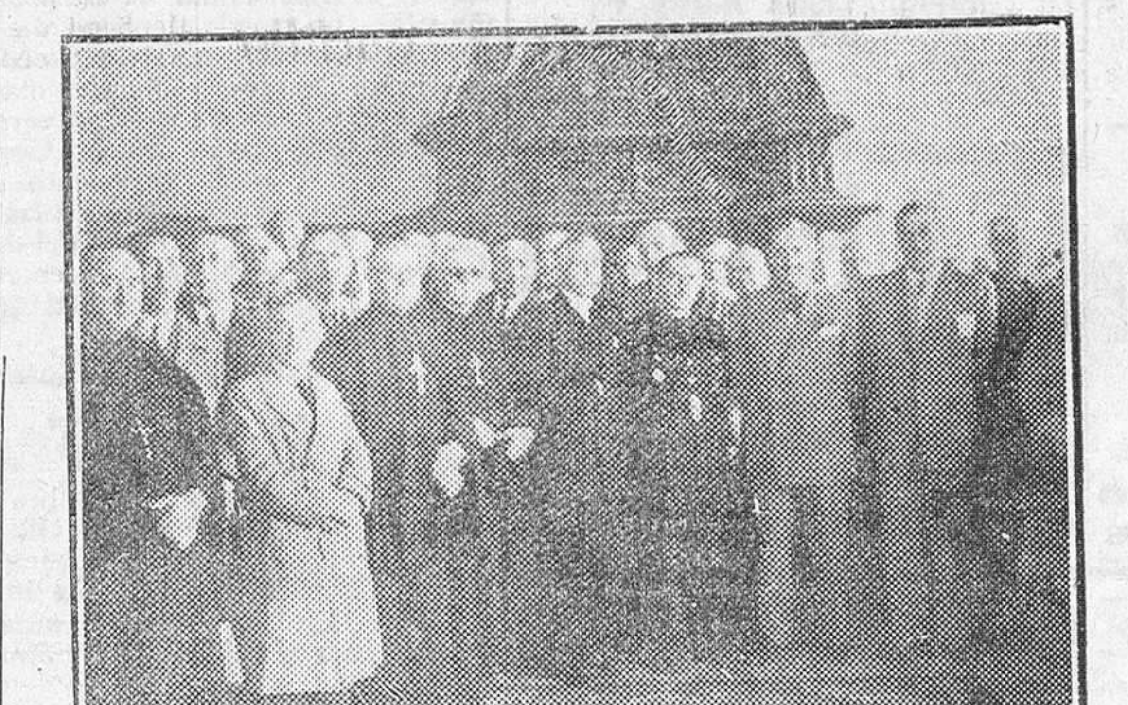
El gobernador civil y jefe provincial del Movimiento y el presidente de la Excelsima Diputación provincial y sub-jefe provincial de la Falange, rodeados de las jerarquías de S. E. M. y maestros y profesores burgaleses, durante el acto celebrado ayer a mediodía en la Casa del Cordón con motivo de la festividad de San José de Calasanz.