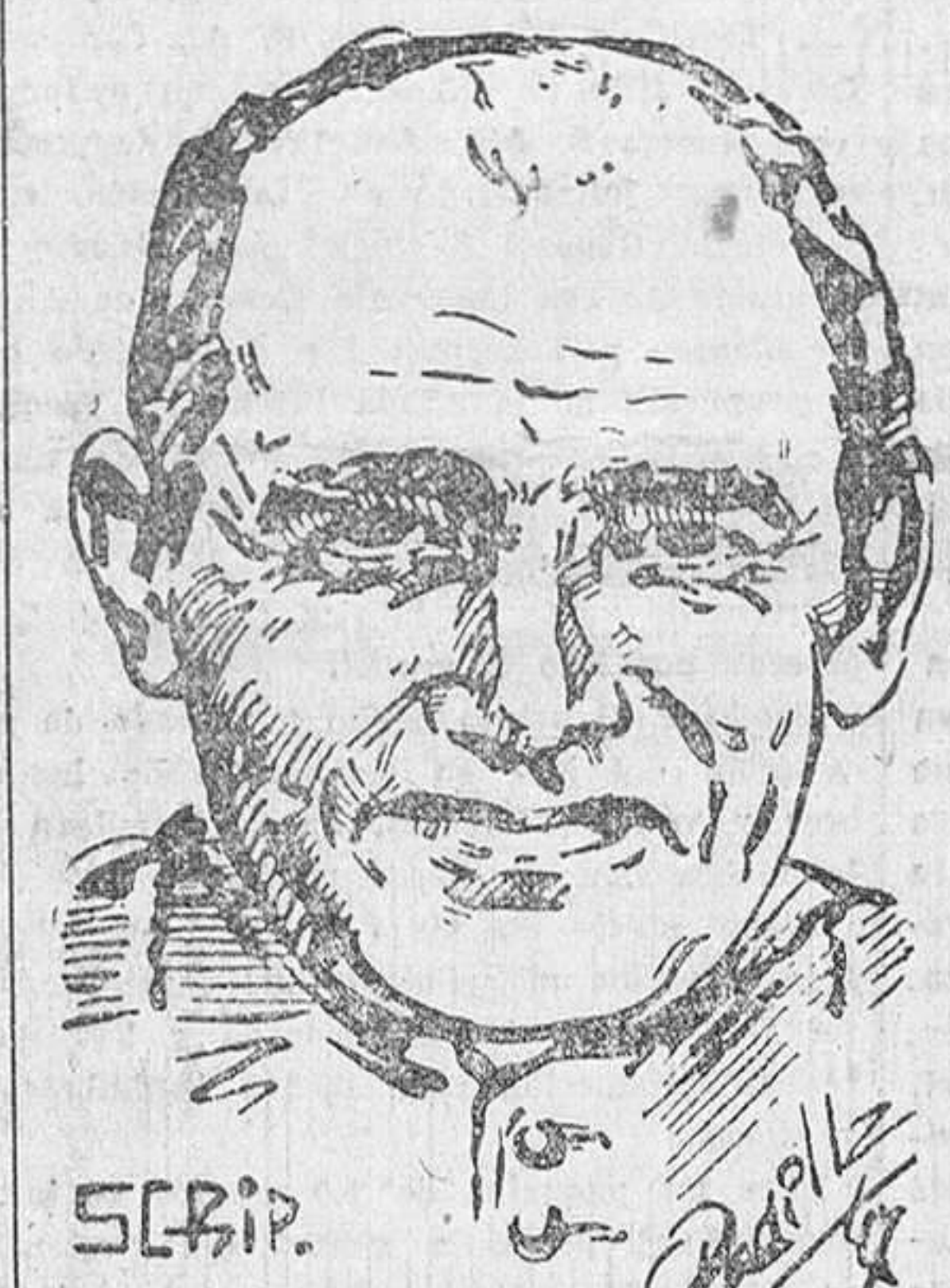
EL EMINENTISIMO CARDENAL SEGURA ARZOBISPO DE SEVILLA

Dentro de breves días vendrá a nuestra ciudad el Hermano Mayor de la Cofradía sevillana del Santísimo Cristo de Burgos para hacer su ofrenda al Ayuntamiento