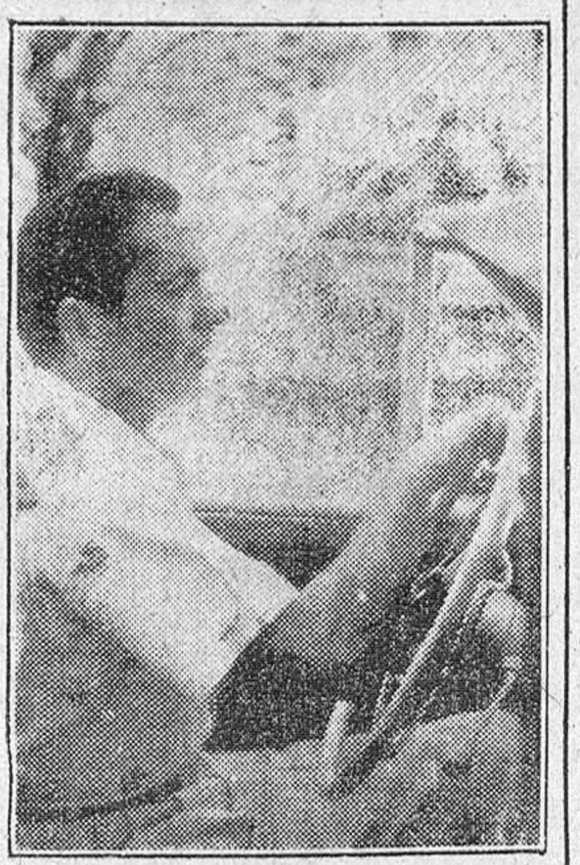
Sevilla.—Tyrone Power, el conocido actor cinematográfico, pasea conduciendo su magnífico automóvil y luciendo una original camisa, estampada con muñecos de colores.

El famoso actor es un hombre tímido, de unos cuarenta años y lleva largas patillas