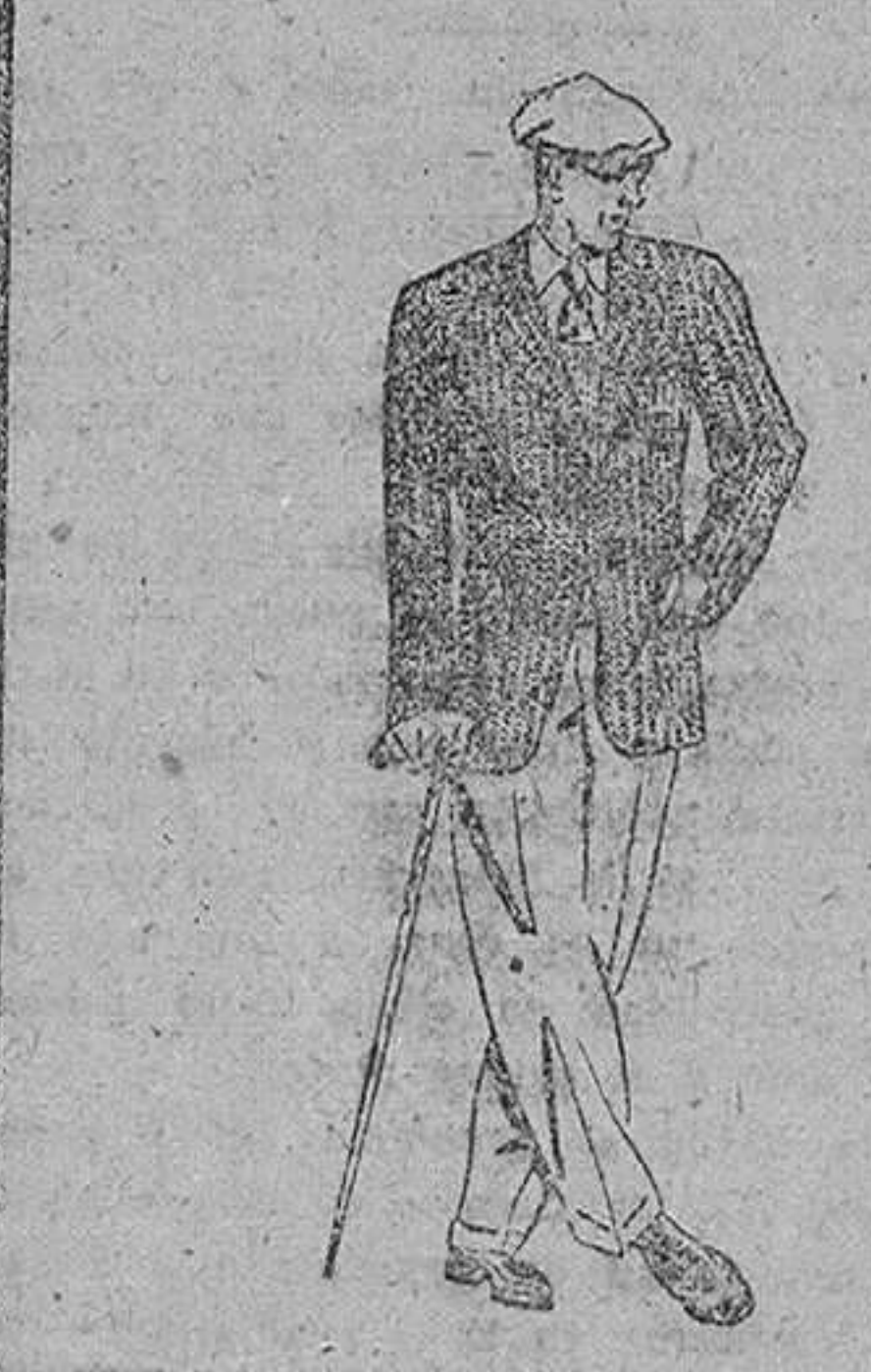
AMERICANA DE SPORT

En las elecciones presidenciales, los políticos derechistas del partido "colorado" no presentaron candidato a la presidencia. Al hacerse ahora cargo del Poder con la ayuda del Ejército, es probable que consideren que la elección de Natalicio González no fue válida y arribalen a éste el sillón presidencial. Pero también puede ser que acepten la primera magistratura de éste pero que le obliguen a gobernar de acuerdo con el régimen tradicional paraguayo. Lo que parece vislumbrarse hasta ahora en el panorama paraguayo es que la revolución no es más que el resultado de la acción política de una de las fracciones en que se divide el partido colorado que lleva asentado más de diez años en el Poder.