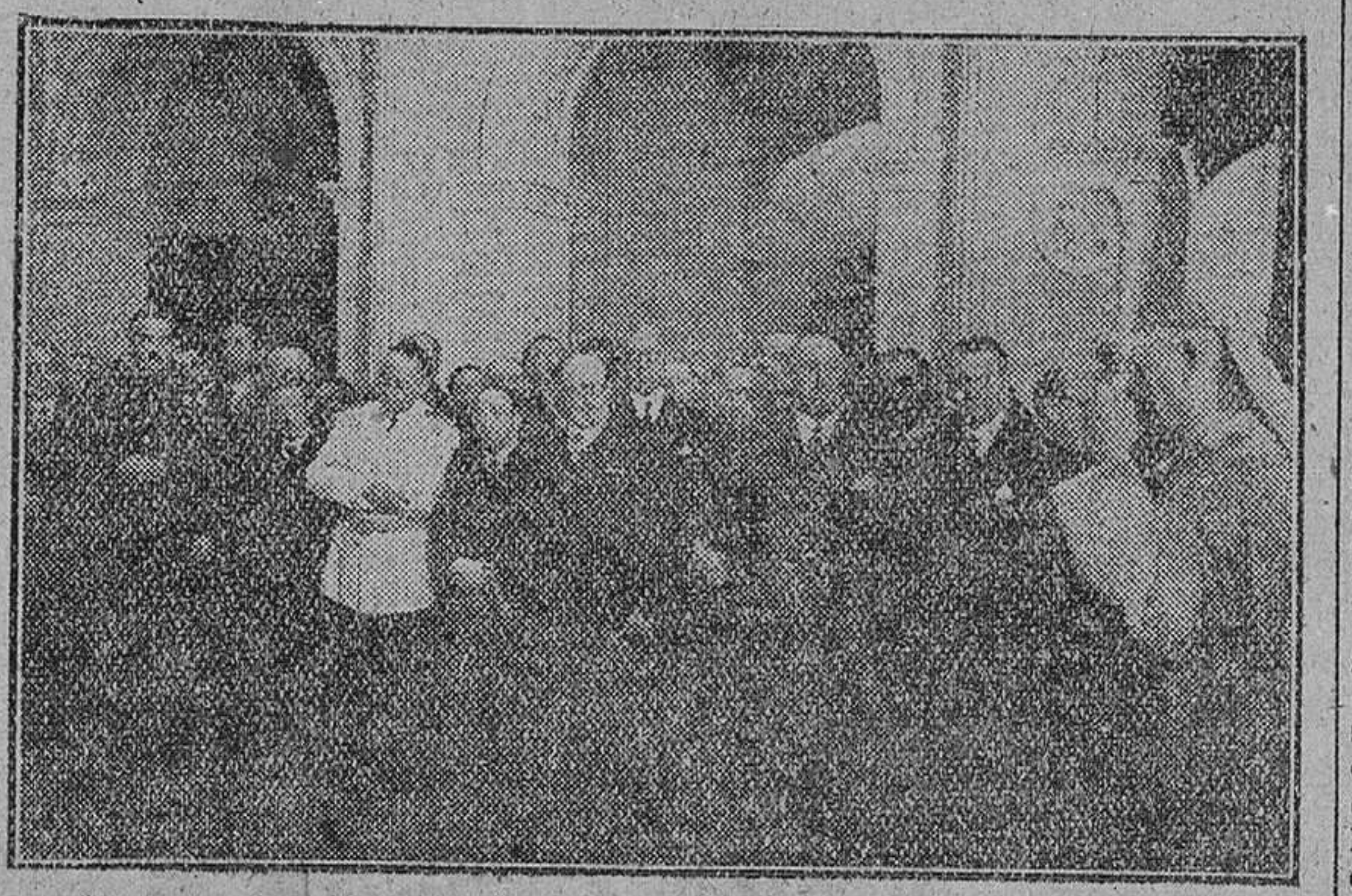
MADRID.—BENDICION E INAUGURACION DEL PALACIO DE JURISDICCION DEL TRABAJO CON ASISTENCIA DEL MINISTRO DEL TRABAJO, OBISPO DE MADRID-ALCALA Y OTRAS PERSONALIDADES.—(Foto SCRIP)