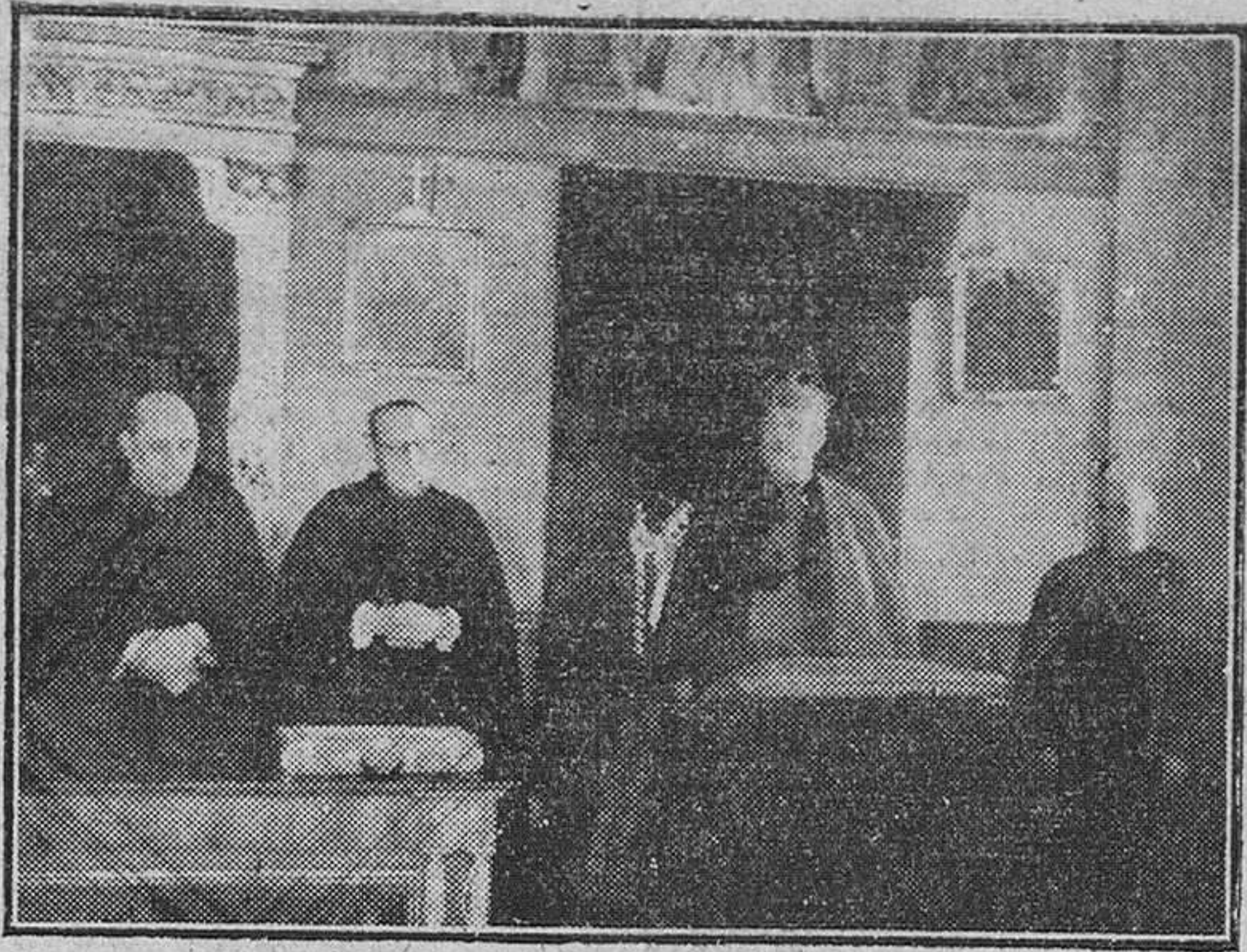
Nuestro Rvmo. Prelado, presidiendo la solemne sesión de clausura del proceso de beatificación del Hermano Bernardo Fábrega Juliá, celebrada ayer, a mediodía, en el Palacio Arzobispal.

Londres. — Las cinco naciones de la "Unión Occidental" han dado hoy los primeros pasos hacia la creación de un frente militar unido contra cualquier ataque soviético en Europa.