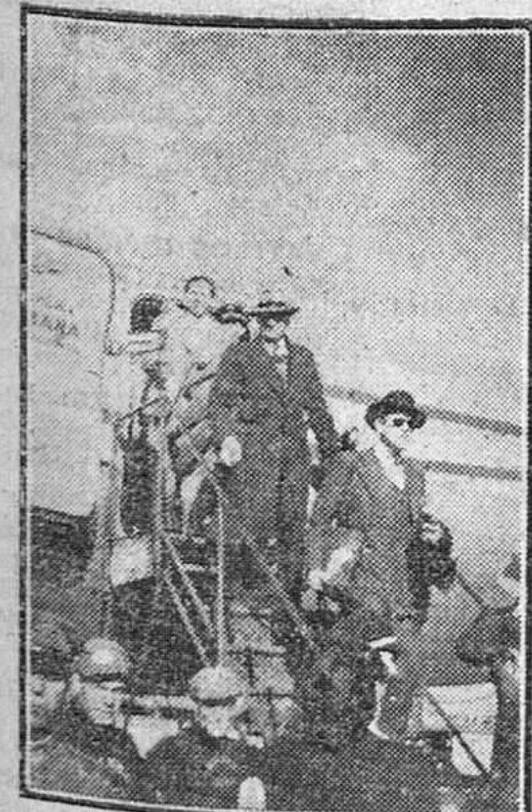
Aeropuerto de Barajas. — Llegada a Barajas del avión "Estrella de Cuba", cuyos pasajeros —periodistas cubanos invitados para visitar nuestra Patria— fueron recibidos por representantes del Ministerio de Asuntos Exteriores, Cultura Hispánica y periodistas de Madrid.