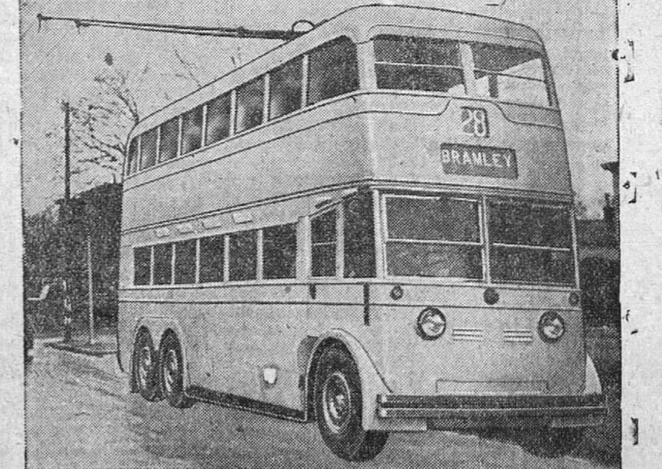
Este magnífico y moderno trolebús, capaz para 71 viajeros, forma parte de un importante pedido de vehículos de este género hecho a una fábrica inglesa con destino a la capital de Africa del Sur