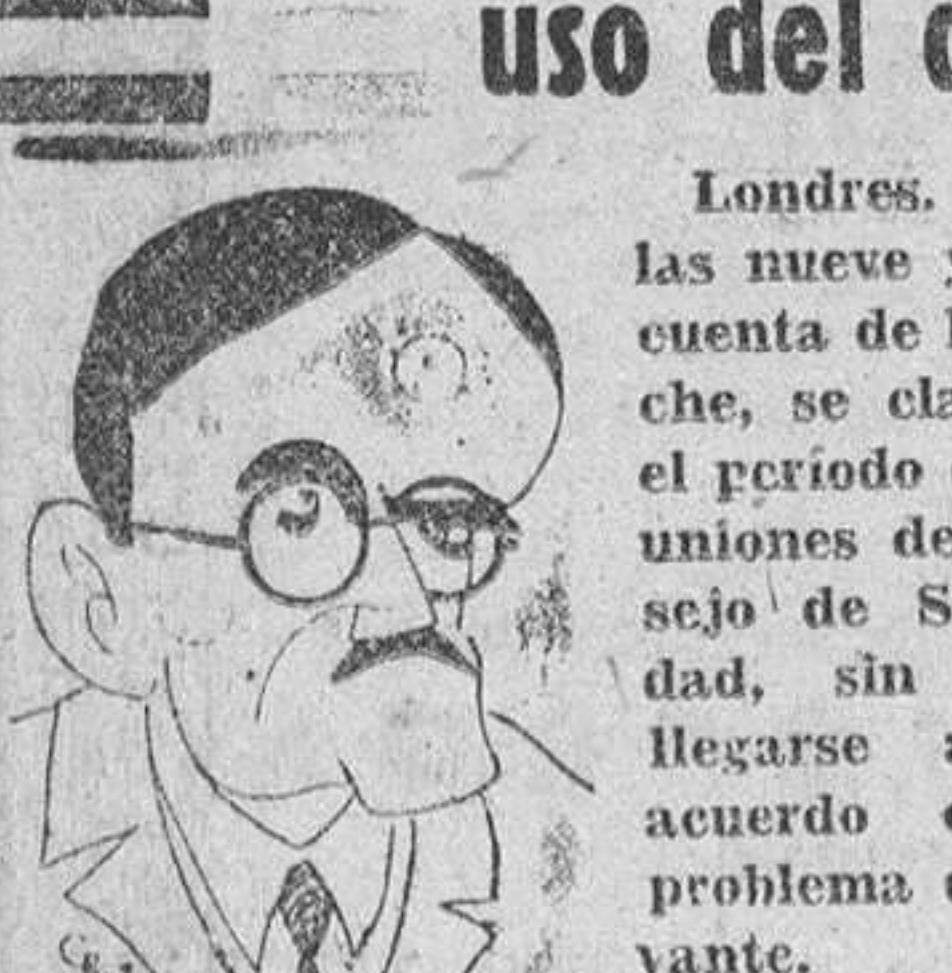
del delegado norteamericano que consistió en que el Consejo expresaba su confianza en que las tropas anglofrancesas serían retiradas de Siria y el Líbano tan pronto como fuera posible, dejando la fecha de evacuación para que se concertara en negociaciones directas. Pero cuando el presidente anunció que la votación era válida y el acuerdo quedaba firme, Vichinsky protestó y declaró que no era válida porque la Unión Soviética había votado en contra.

Cuando ya se había adoptado acuerdo en el problema de Levante, Vichinsky hace uso del derecho de veto