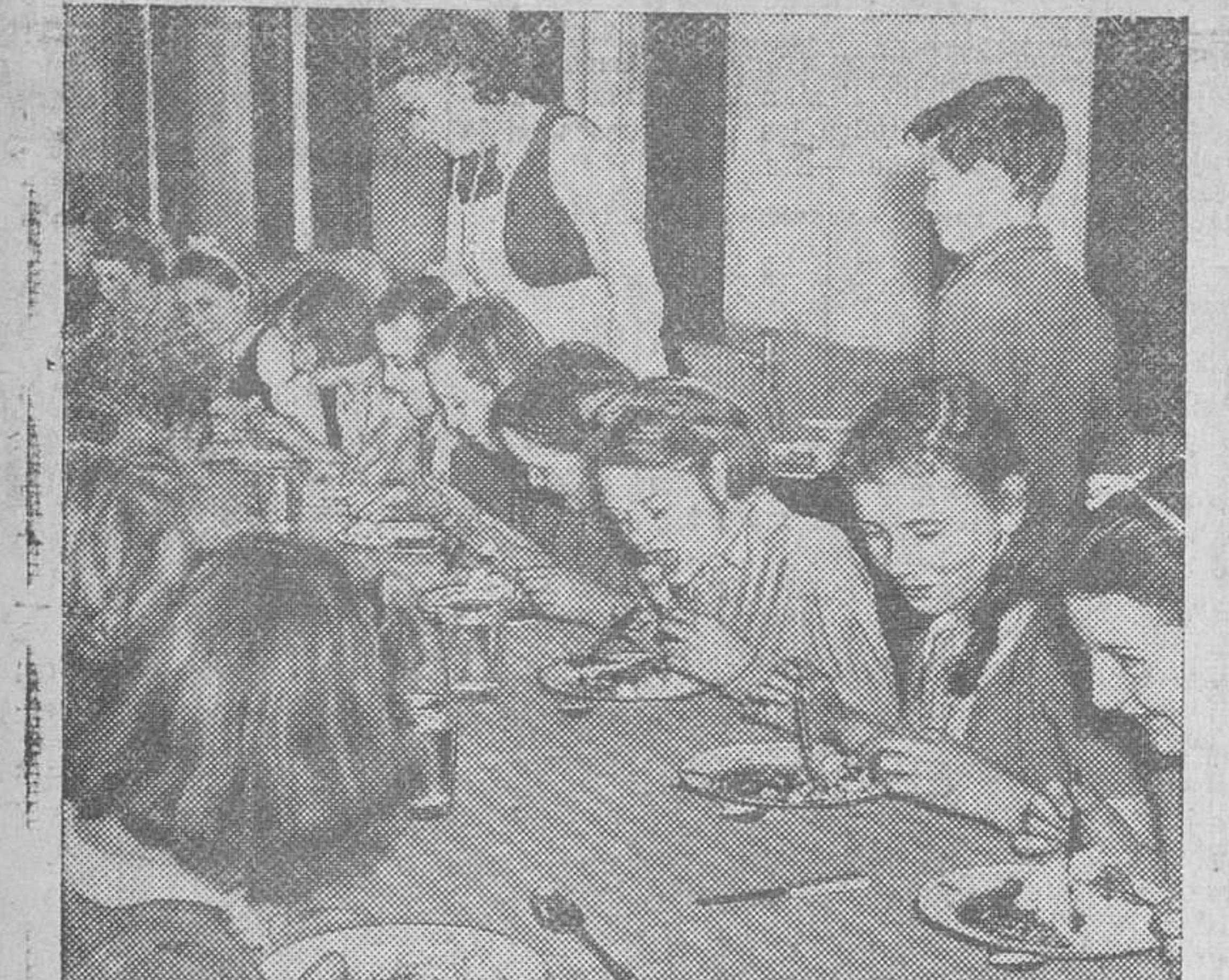
EN ESTA ESCUELA ELEMENTAL INGLESA SE REPARTE DIARIAMENTE COMIDA CALIENTE A MAS DE DOSCIENTOS NIÑOS POBRES DE LOS ALREDEDORES QUE ACUDEN A LAS CLASES