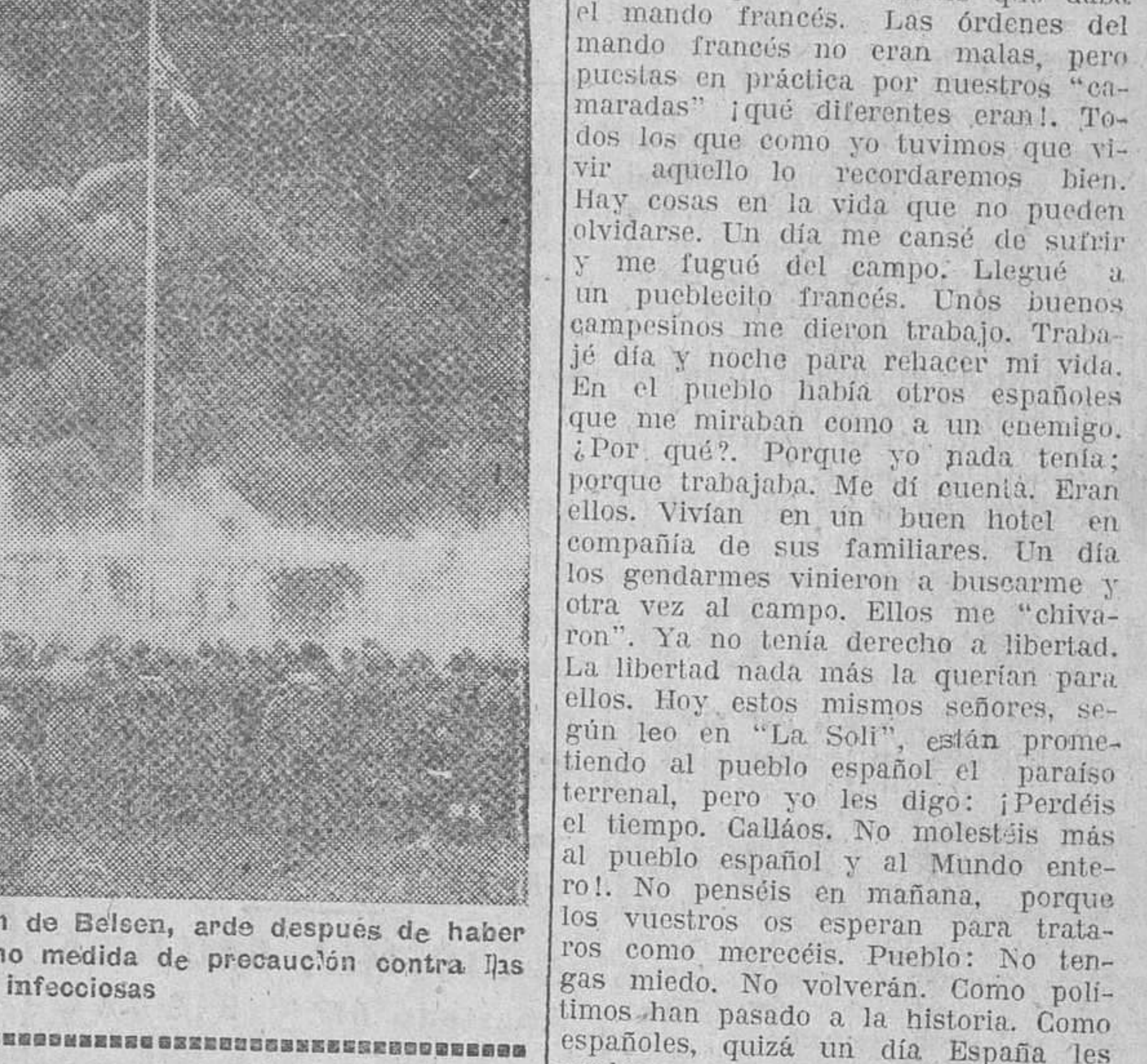
El ya histórico campo de concentración de Belsen, arde después de haber sido incendiado por los británicos como medida de precaución contra las enfermedades infecciosas