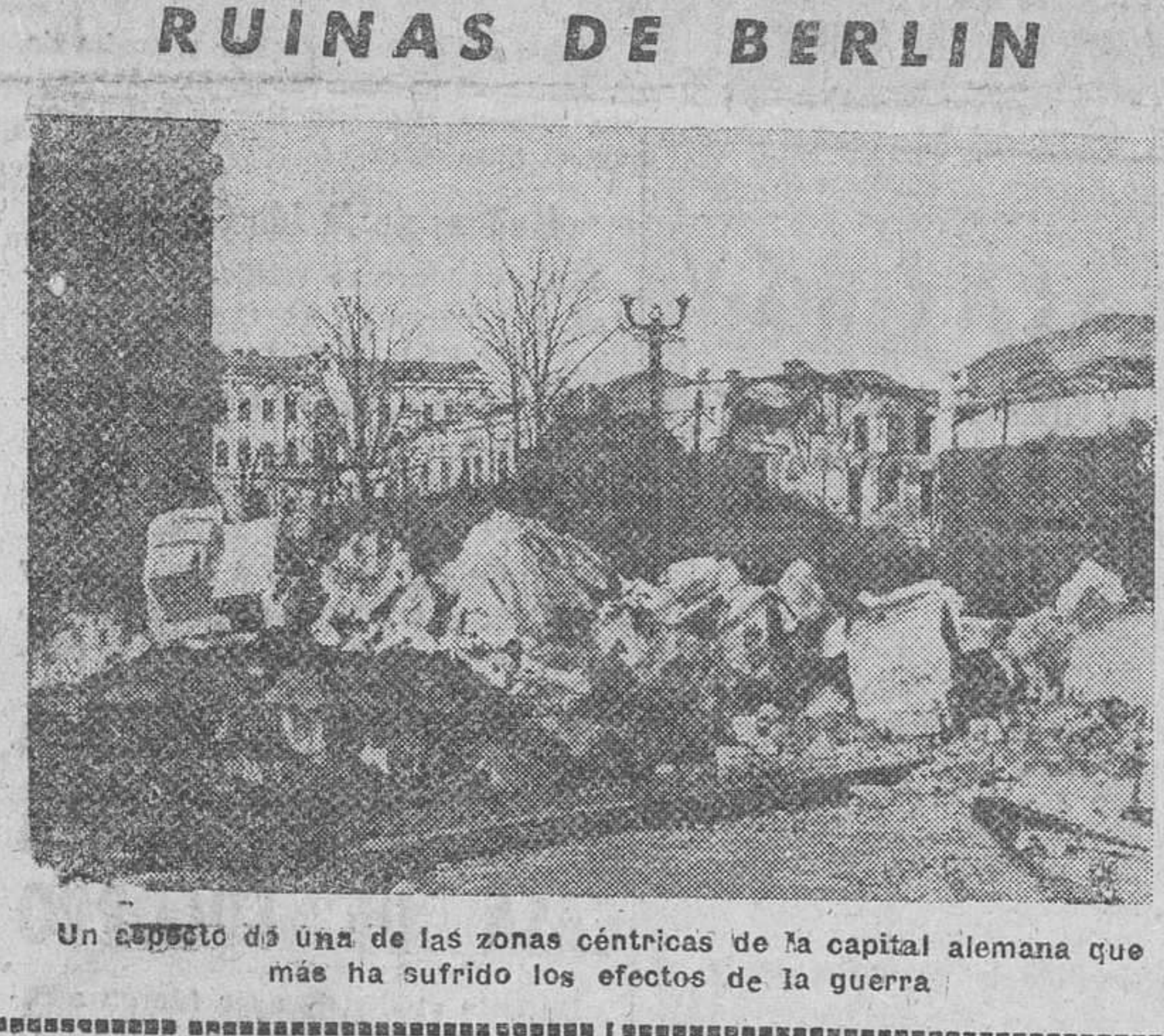
Un aspecto de una de las zonas céntricas de la capital alemana que más ha sufrido los efectos de la guerra

Porque Cristo ha venido a redimir a todos los hombres y hay 1.400.000.000 de infieles que le desconocen, que nunca oyeron hablar de él. De ti depende el acelerar su reino en la tierra. El cielo está esperando tu decisión, para enviar la lluvia de las gracias de conversión a pueblos y naciones enteras sumidas en las tinieblas de la pagandía.