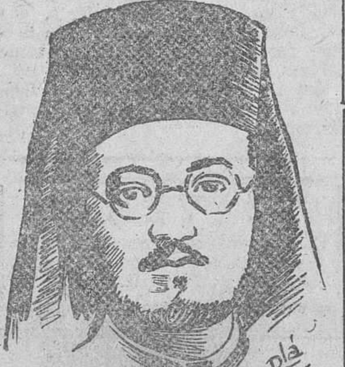
Atenas.—Oficialmente se anuncia que el Regente Damaskinos se ha encargado de la jefatura del Gobierno.—Efe.

A excepción de Vulgaris, ministro de Hacienda, el Gabinete no ha sufrido modificaciones