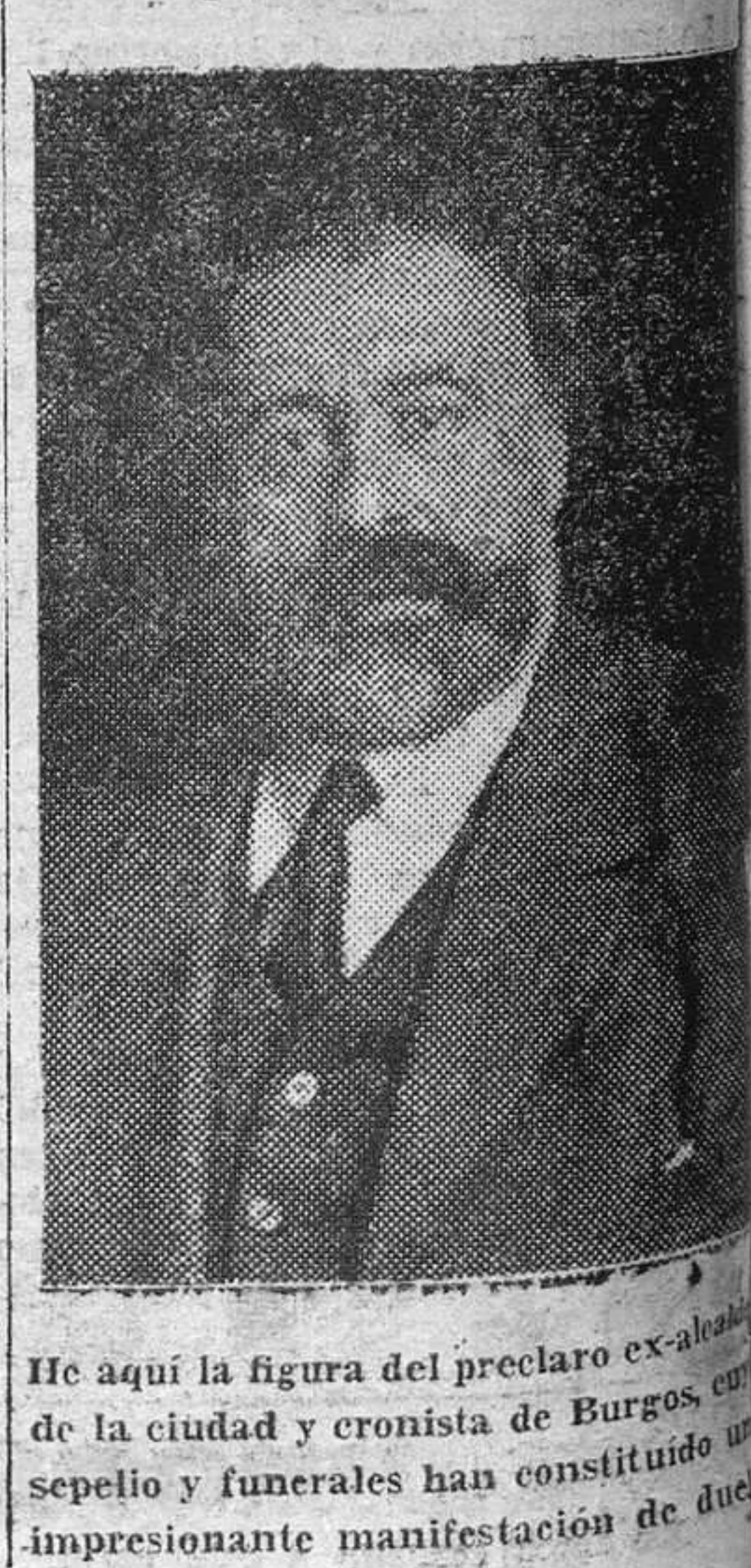
He aquí la figura del preclaro ex-alcalde de la ciudad y cronista de Burgos, cuyo sepelio y funerales han constituido una impresionante manifestación de duelo.