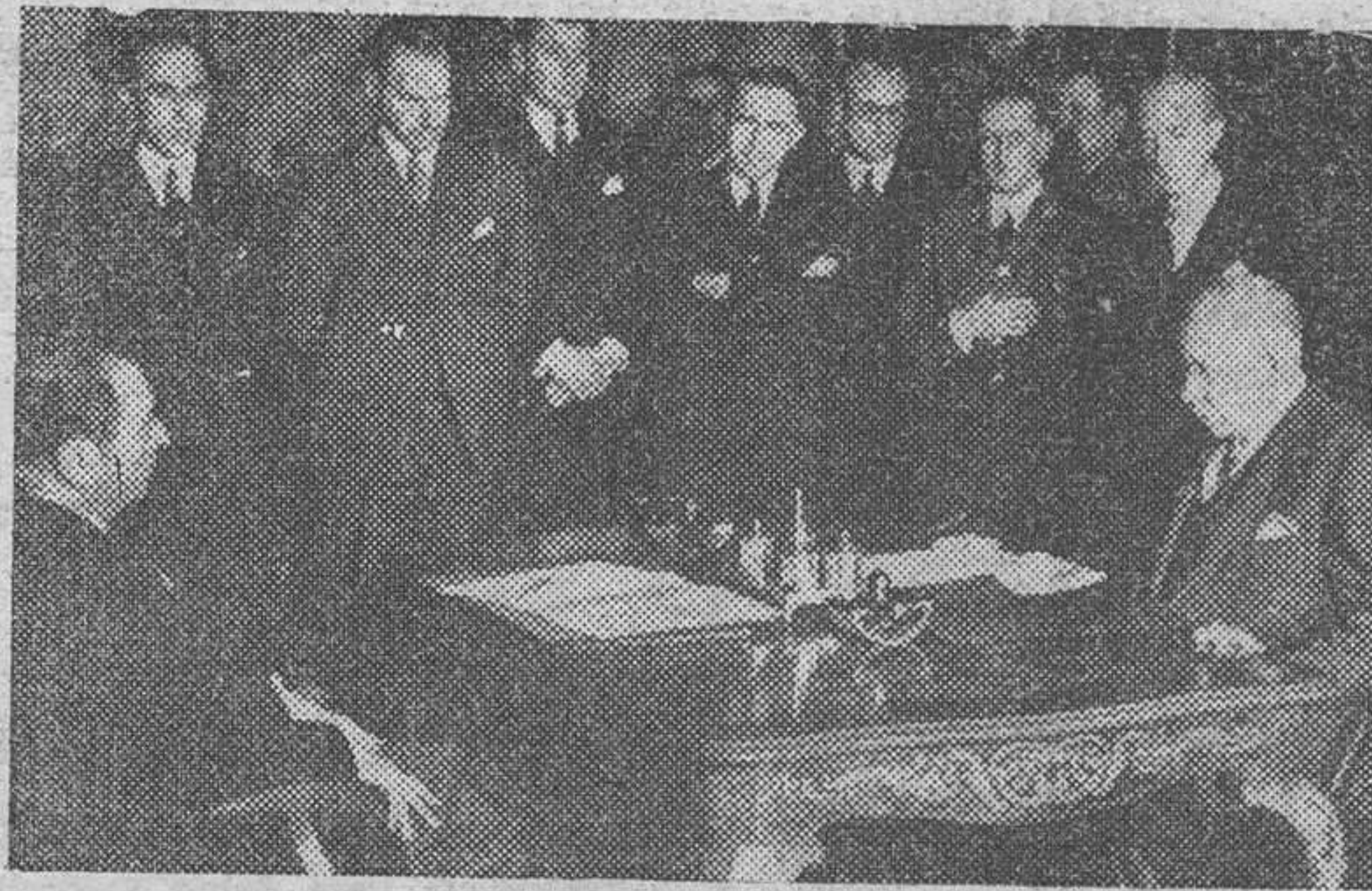
Madrid.—En el Palacio de Santa Cruz el ministro de Asuntos Exteriores Sr. Lequerica y el embajador de Estados Unidos, celebran el canje de notas con los términos del convenio de servicios internacionales de transporte aéreo. Documento de gran importancia en nuestras relaciones internacionales